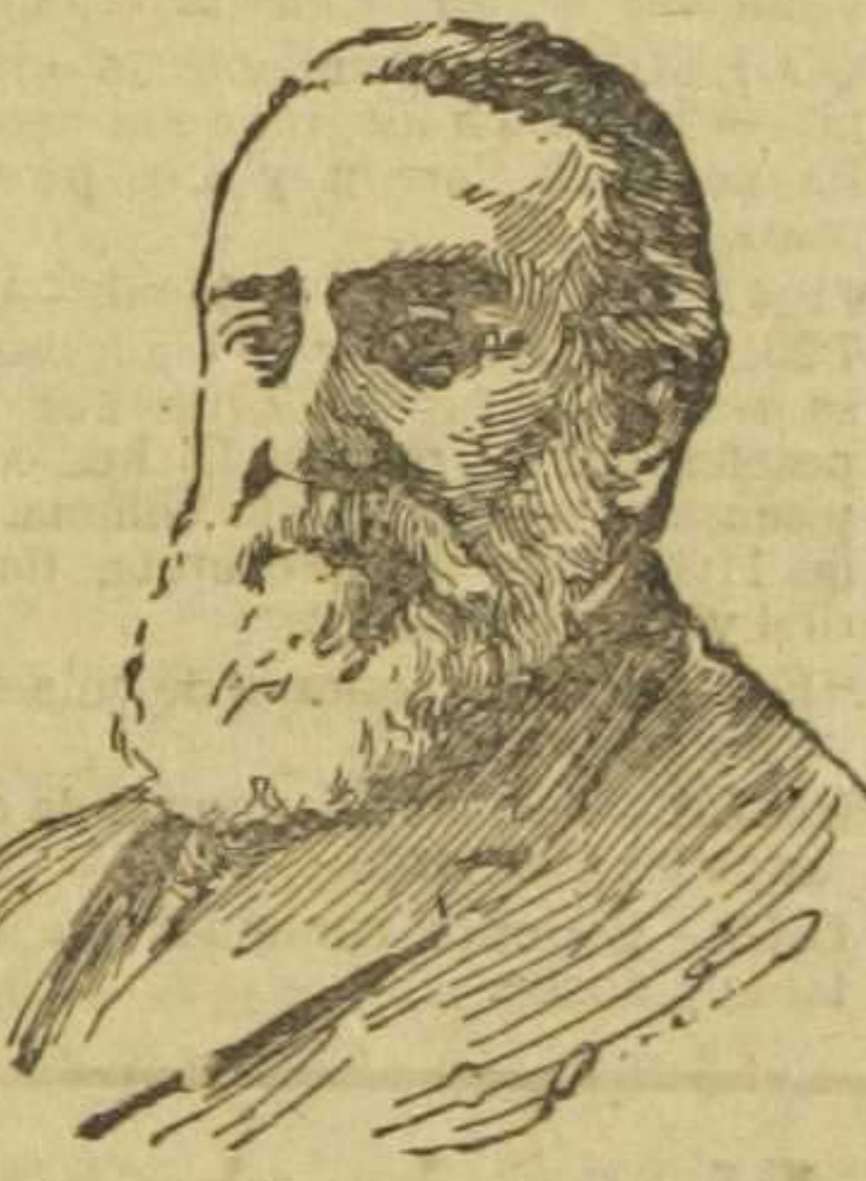
Sr. Rodríguez Marín ilustre escritor.