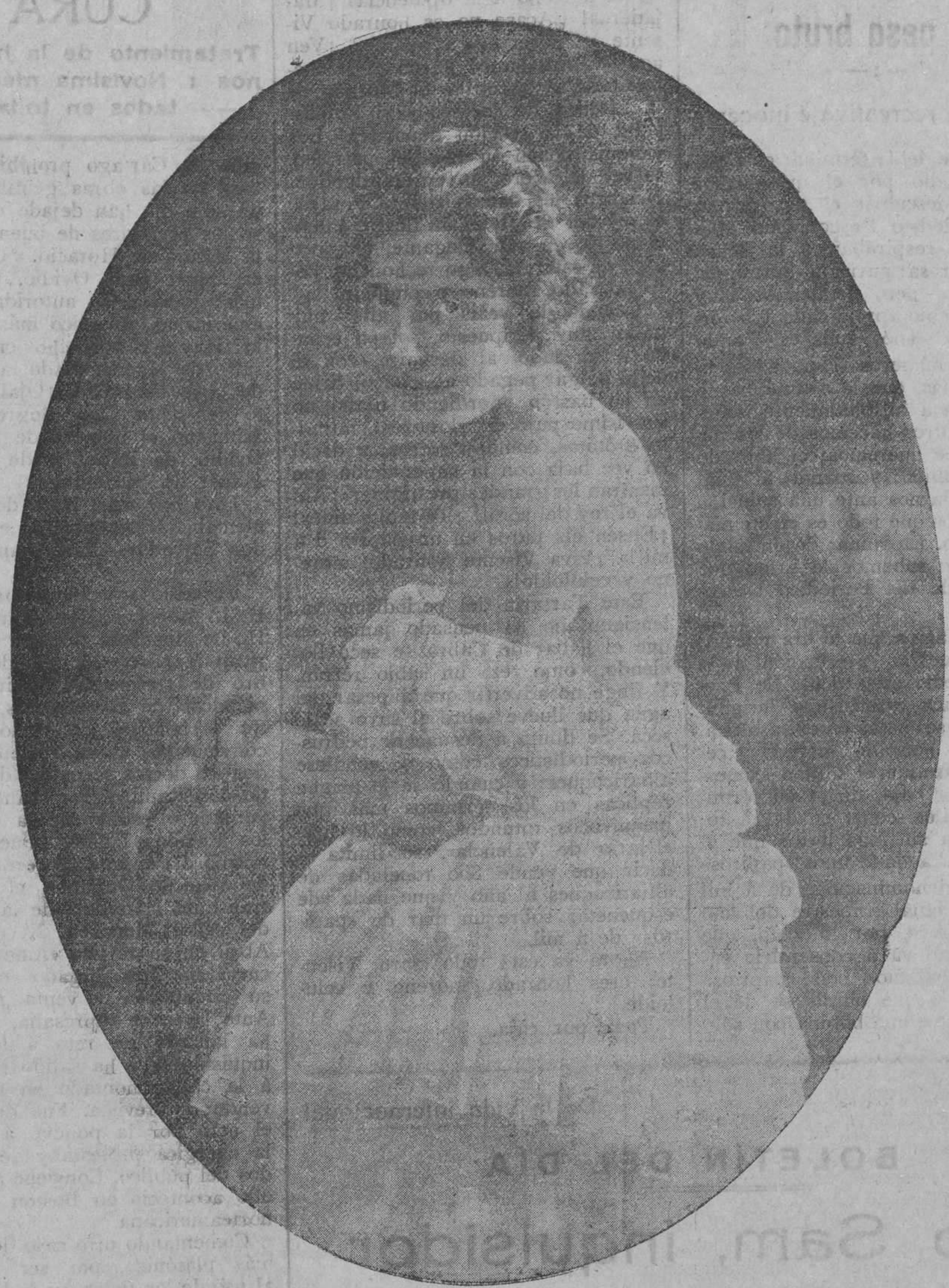
CARMEN VIANCE Eminente estrella de la cinematografía española