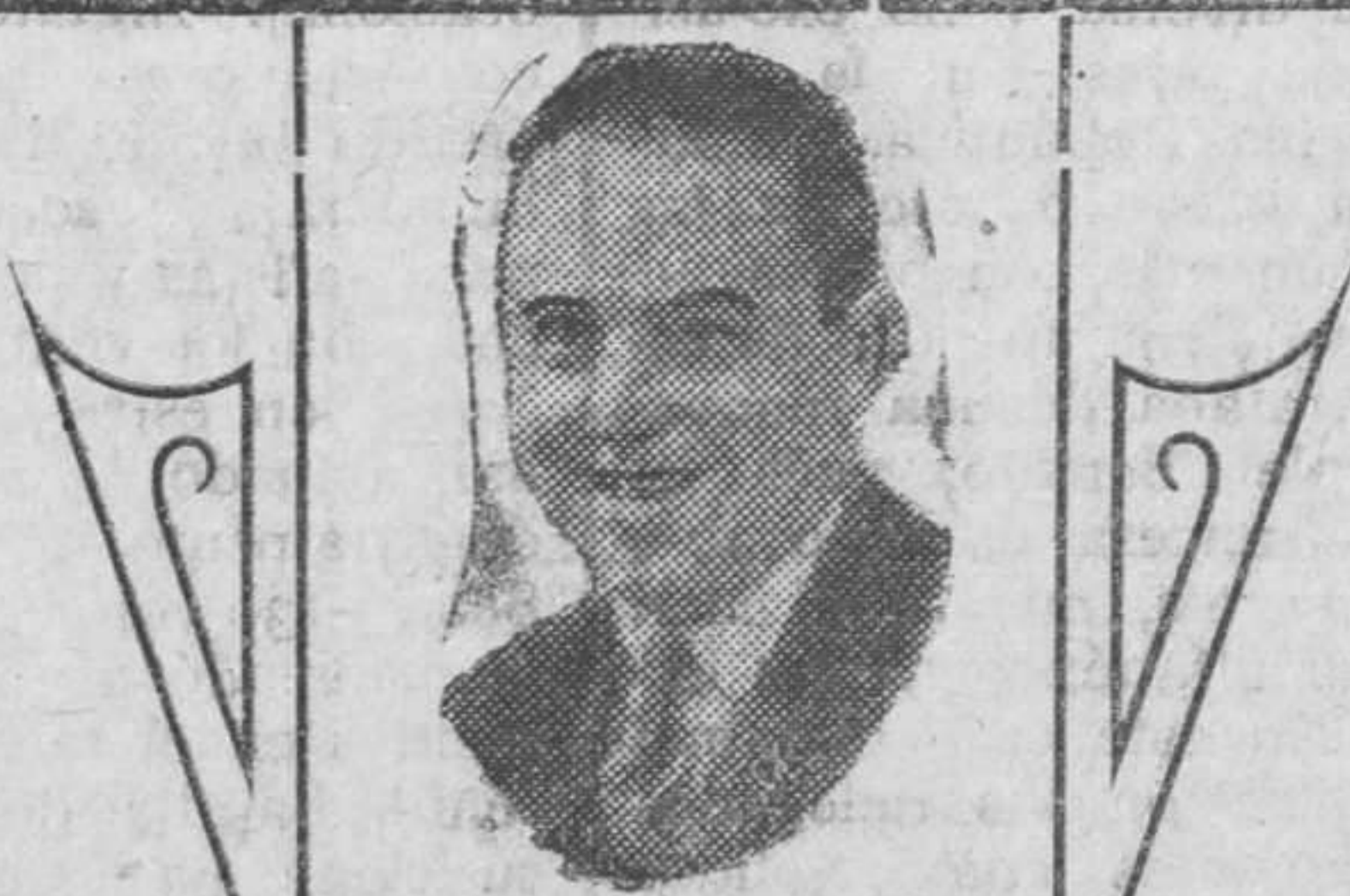
FERNANDEZ ARDAVIN Autor de la obra y adaptador a la pantalla