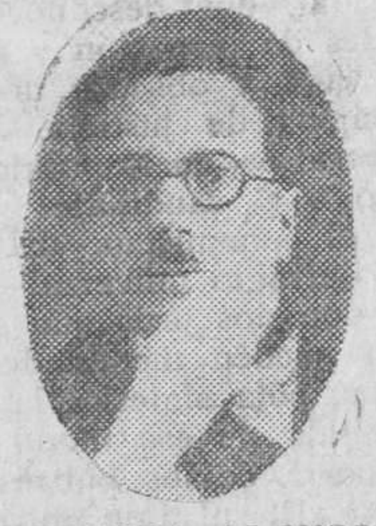
MAESTRO ALONSO Autor de la música