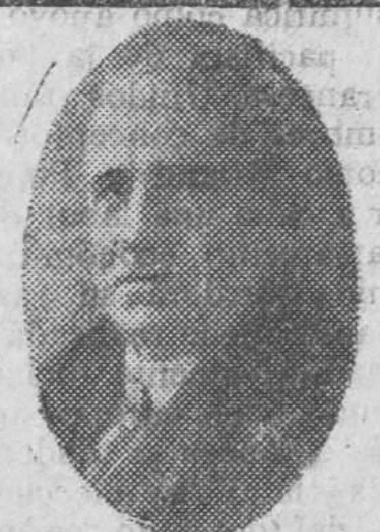
MAESTRO SERRANO Autor de la música