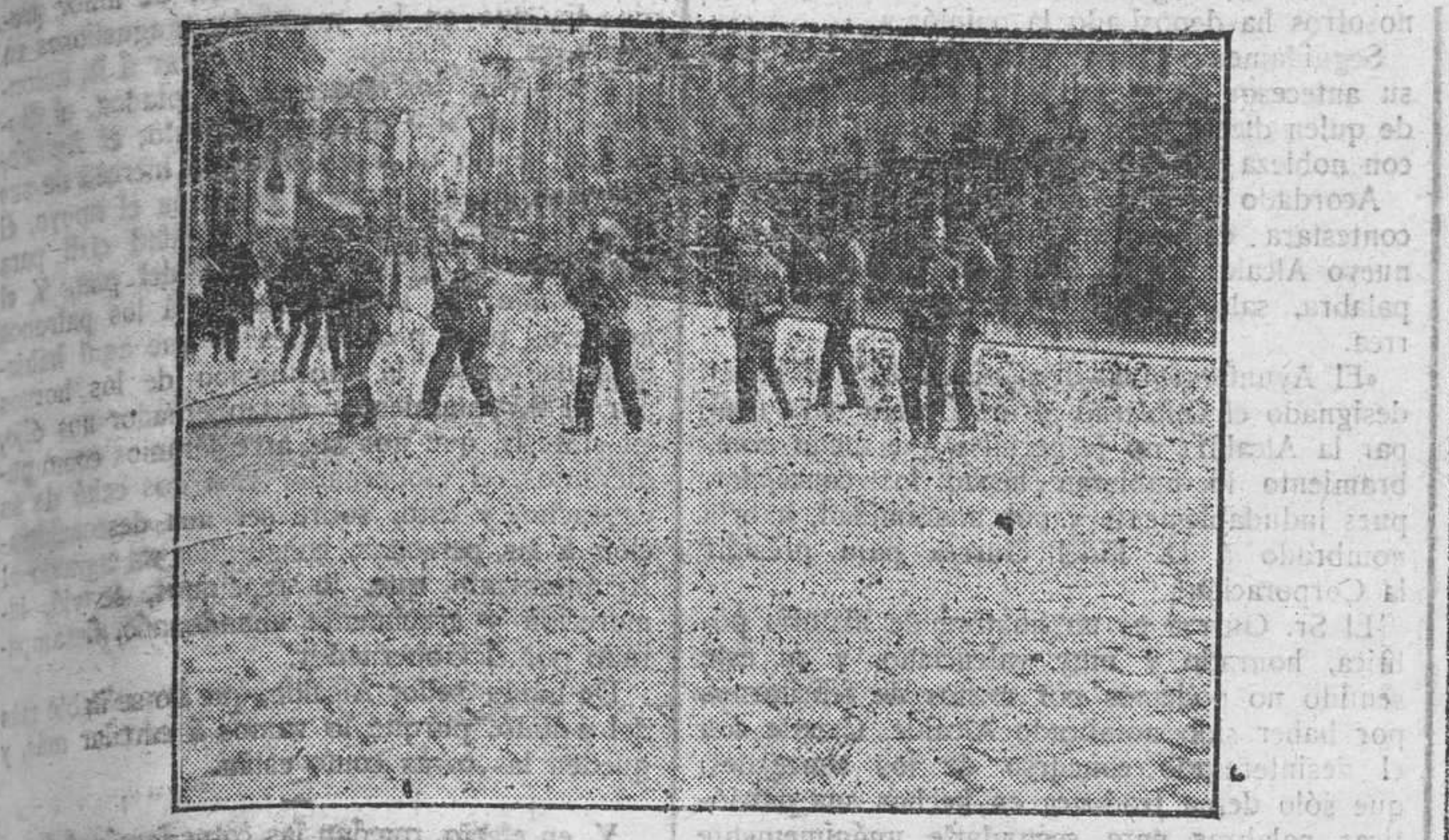
La guardia civil se dispone á dar una carga en la plaza de Emilio Castelar

—¿Qué quieren ustedes? —Que no pasen en automóvil. —Somos médicos. ¿Si tuviéramos que asistir á alguna de sus familias, se opondrían á que viajásemos en auto? —No, señor. Perdonen. Ignorábamos quienes eran ustedes. Creíamos fuesen otras personas. Sigán, y perdonémos, respondieron los obreros. Inmediatamente el auto se alejó.