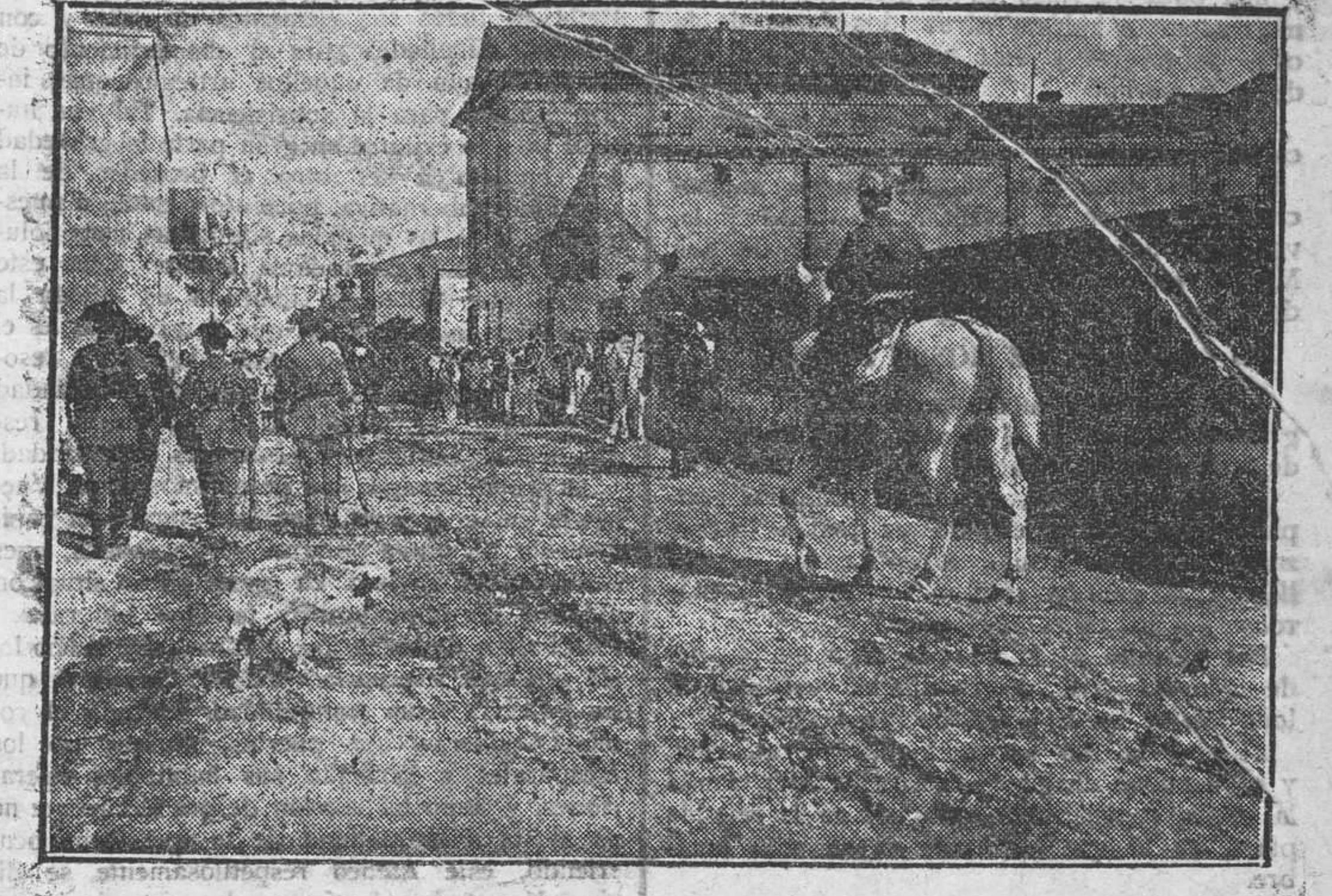
EN LOS POBLADOS MARÍTIMOS.—Fuerzas de la guardia civil disolviendo á grupos de mujeres huelguistas.

LOS TRANVIAS DE GODELLA. A las nueve de la mañana un grupo de huelguistas, en su mayoría muchachos, se situó en mitad del camino de Godella, obligando á los coches á dirigirse á la cochera.