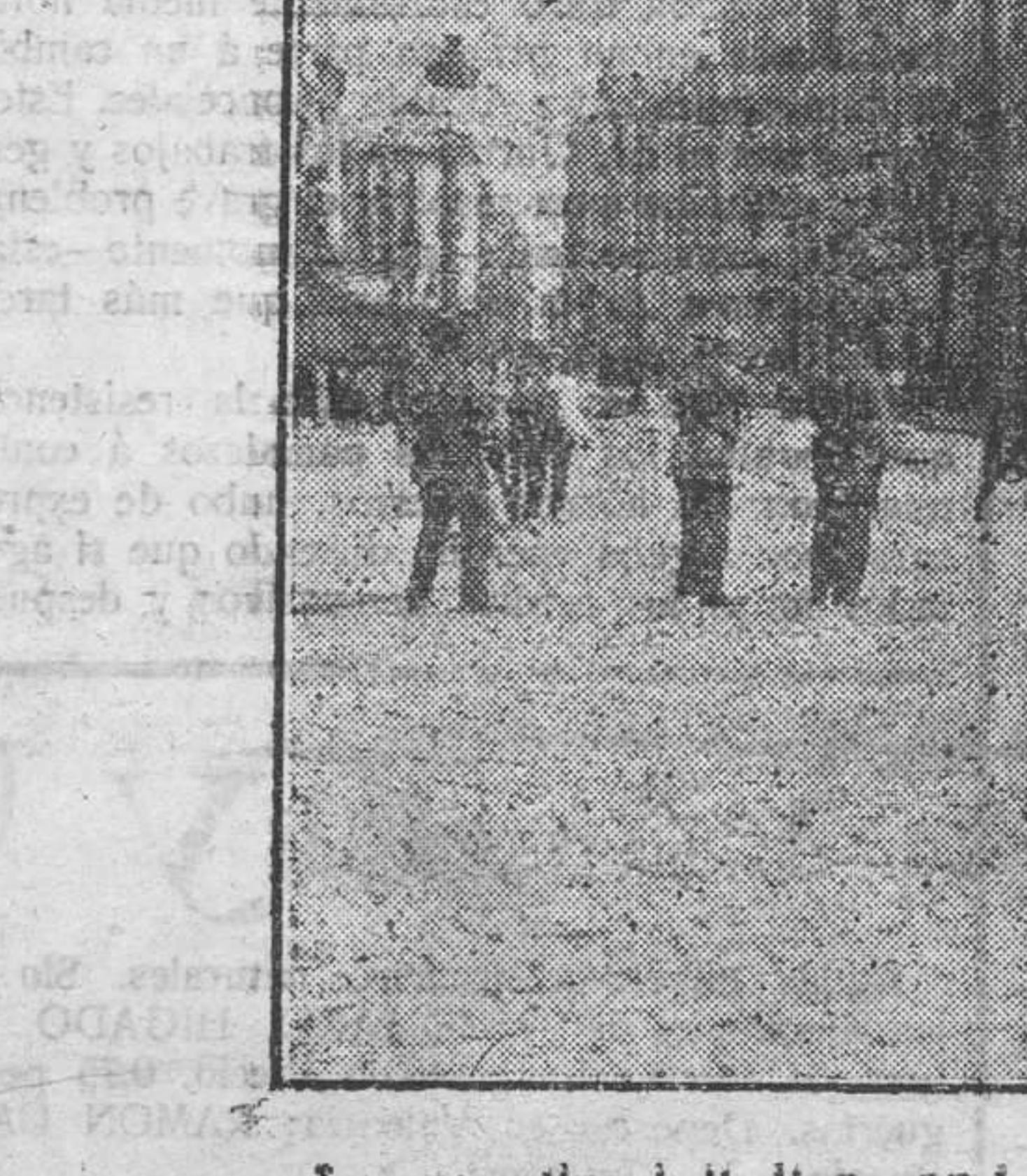
La guardia civil disparando contra los manifestantes

En Valencia reina tranquilidad. La población está abastecida de pan, y ningún incidente ha ocurrido. Se trabaja en los hornos, y se trabajará