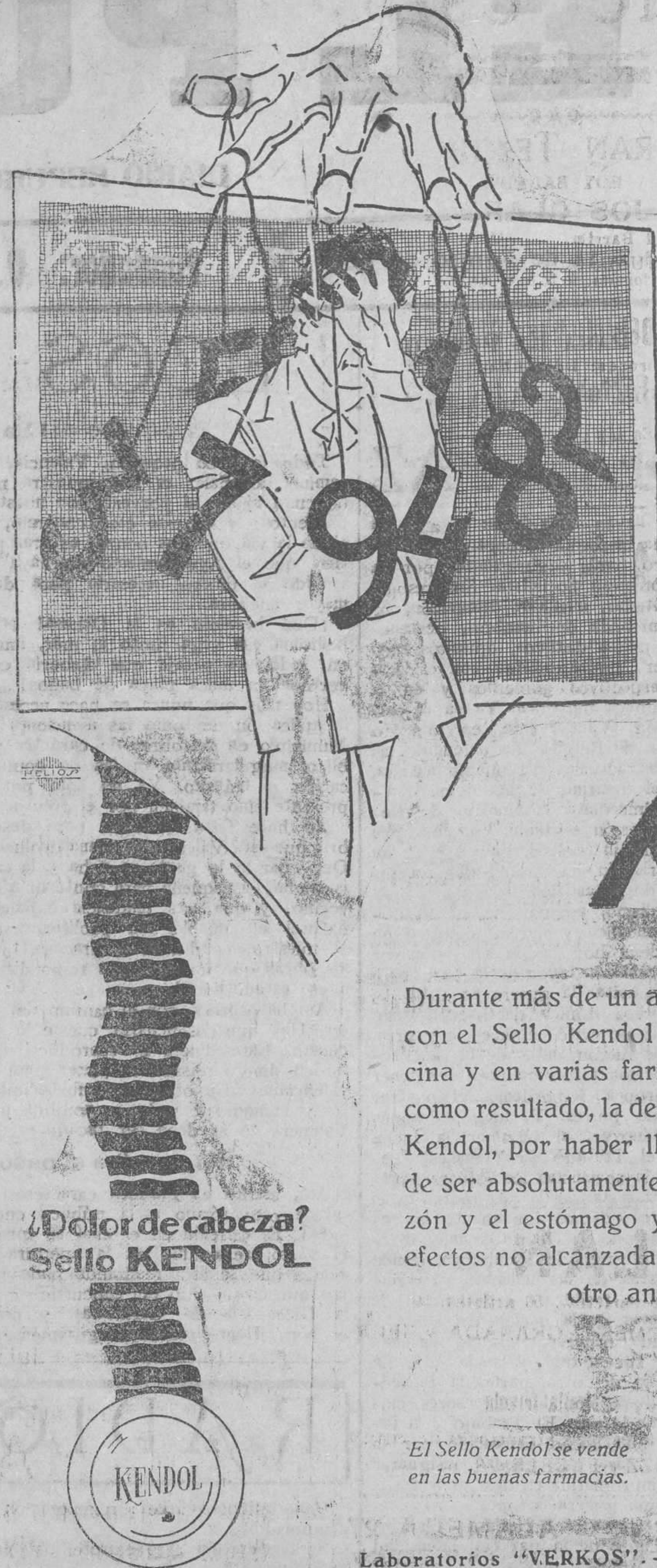
¿Dolor de cabeza? Sello KENDOL

En la mencionada secretaría, horas indicadas, estará de manifiesto el pliego de condiciones a que habrán de sujetarse los concursantes. Valencia 10 de Agosto de 1928.—El presidente, Carlos Fernández de Córdoba.