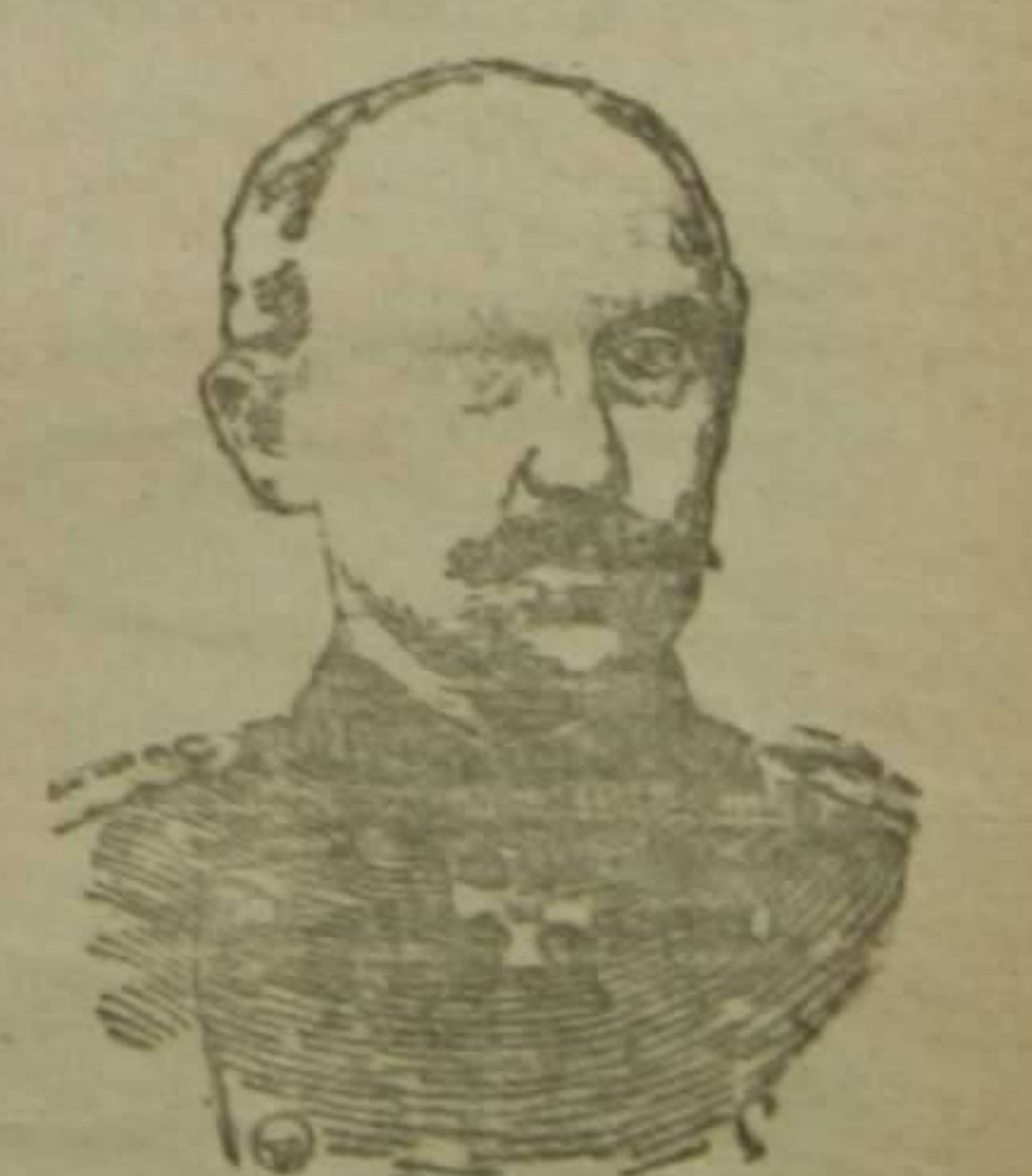
General von Betow que manda el ejército alemán que opera en la región de Riga