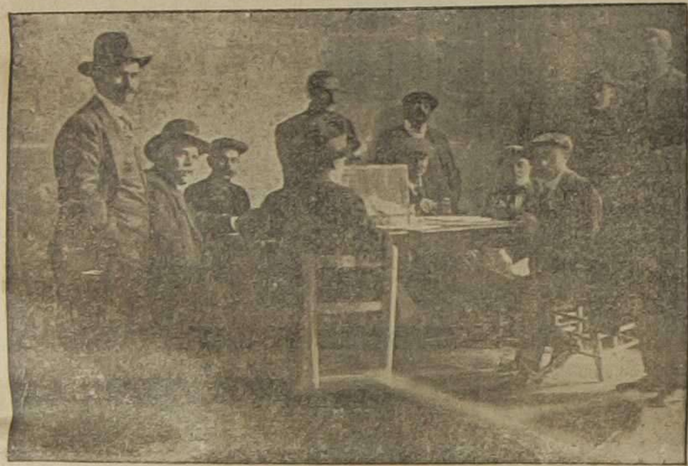
Interior de uno de los colegios de la Lonja durante la votación.

La impotencia de los sectarios se manifiesta en sus atentados brutales. Iluminaciones y colgaduras, tracas y vítores en los casinos monárquicos. Los calumniadores son arrollados. Regocijo general. Despecho y aniquilamiento de los azzatistas y blasqueros. La sombra de manzanillo de "El Mercantil Valenciano" lleva, como siempre, a la derrota a aquellos a quienes apoya.