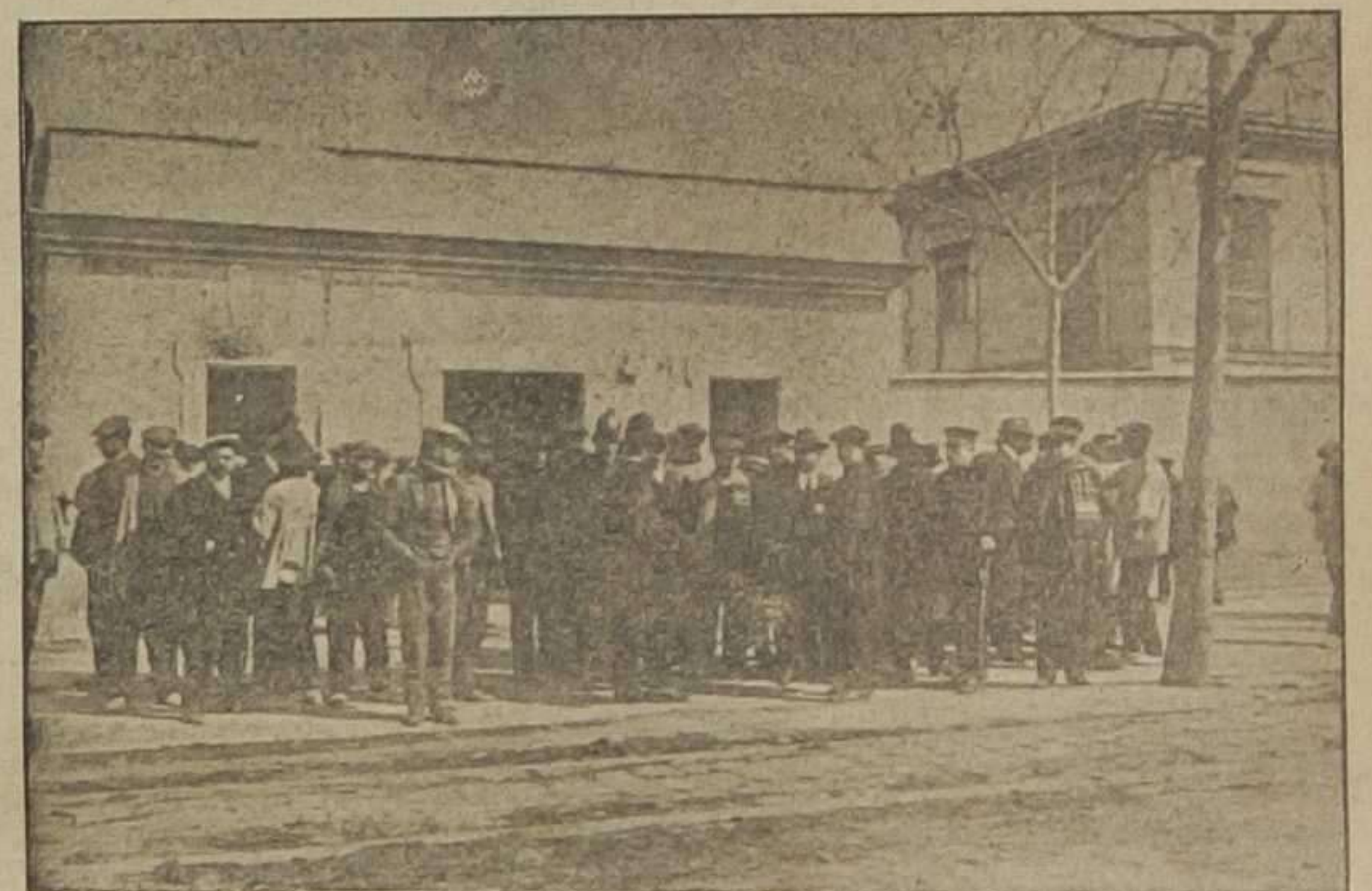
Exterior del colegio del Portazgo del camino del Grao, al ser detenido un republicano que pretendía votar por los fieles difuntos.

A todos deben los buenos agradecimiento por el trabajo y las molestias que les ha ocasionado el cumplimiento de este deber, tan olvidado y descuidado por quienes aún no han logrado darse cuenta de la importancia que las elecciones tienen.