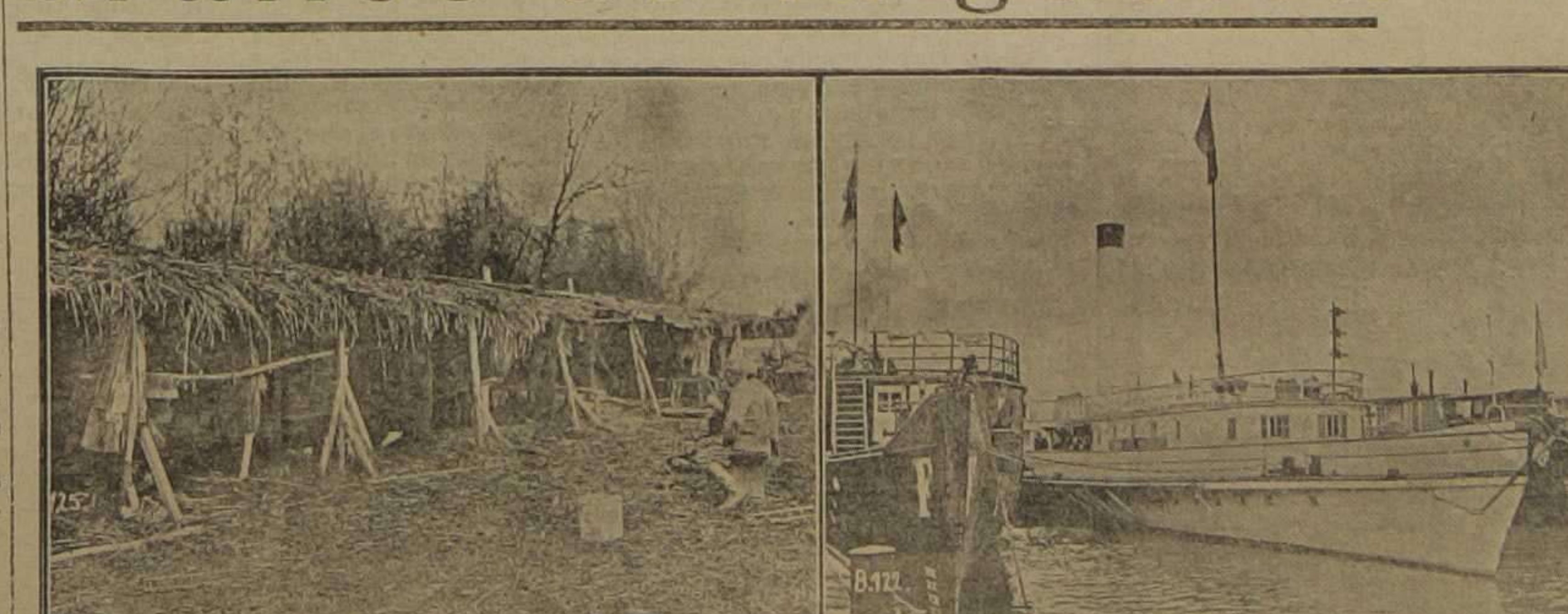
Como se viste las tropas serbias para la campaña de invierno