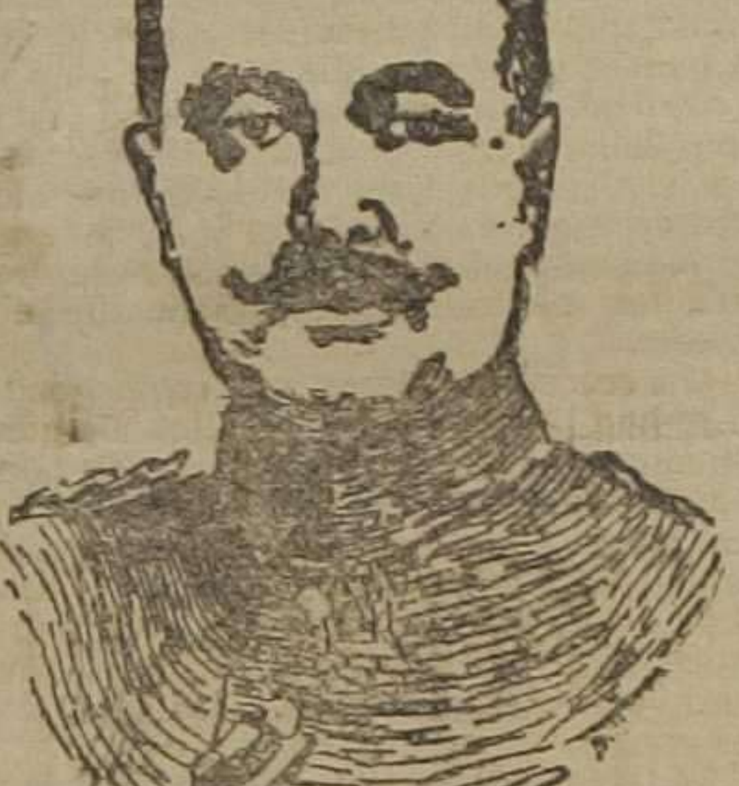
General cuartel-maestre Wild von Hohenborn, nuevo ministro de la Guerra de Alemania