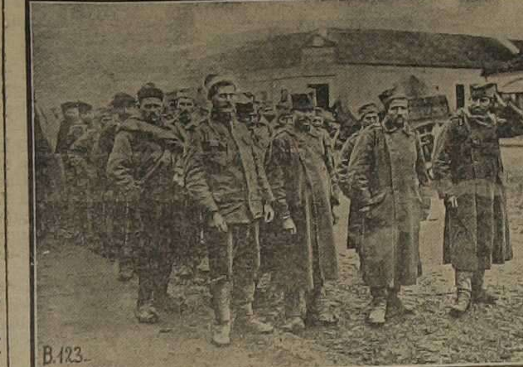
Soldados serbios prisioneros de los alemanes, camino de Berlín

Los Tabacos también avanzan tres puntos y se colocan en 263.