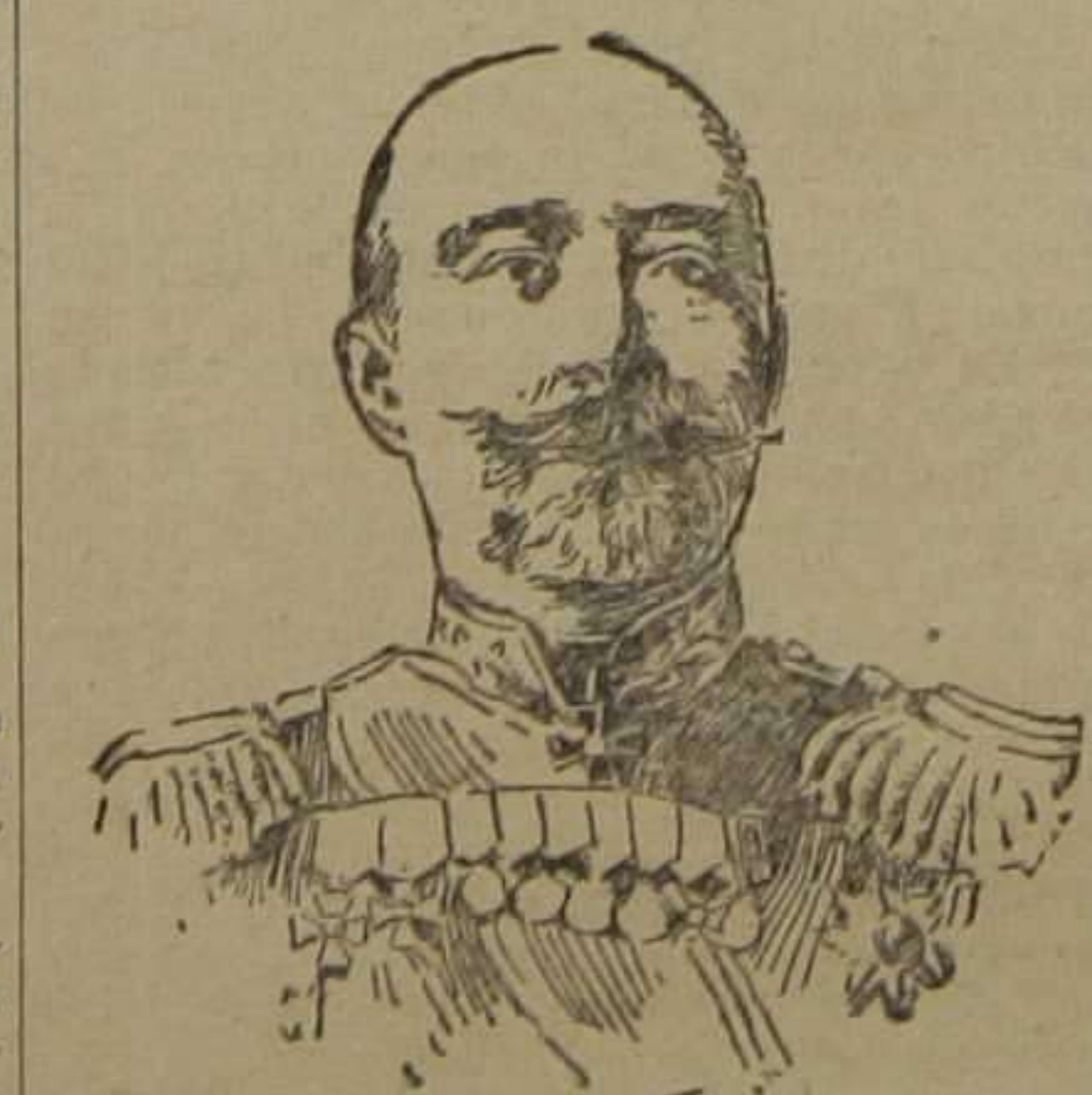
El general Stoessel, defensor de Port-Artur en la guerra ruso-japonesa, fallecido en San Petersburgo