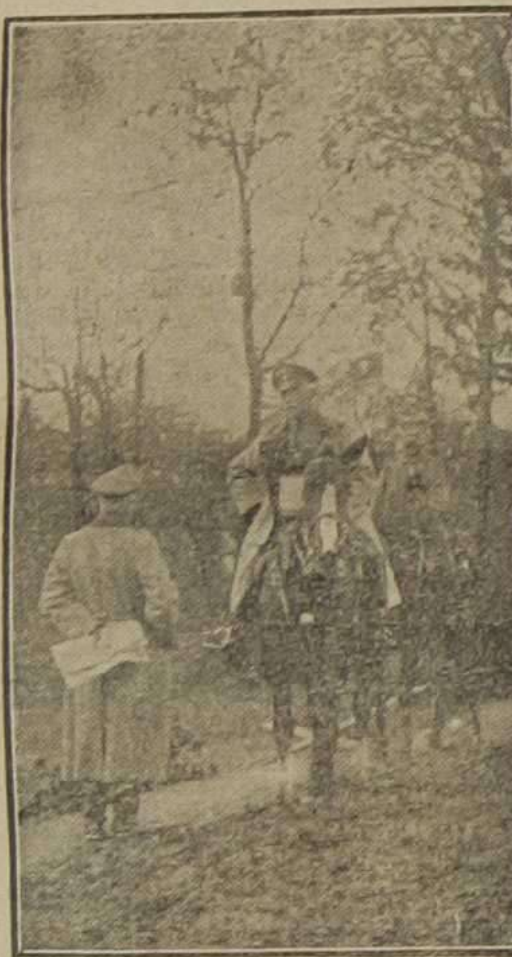
El general von François, que manda las fuerzas alemanas que operan en la Prusia oriental, recibiendo informes

"Los dos sargentos" es el mayor éxito conocido y se exhibirá hoy y mañana en el cine El Cid, a precios populares.