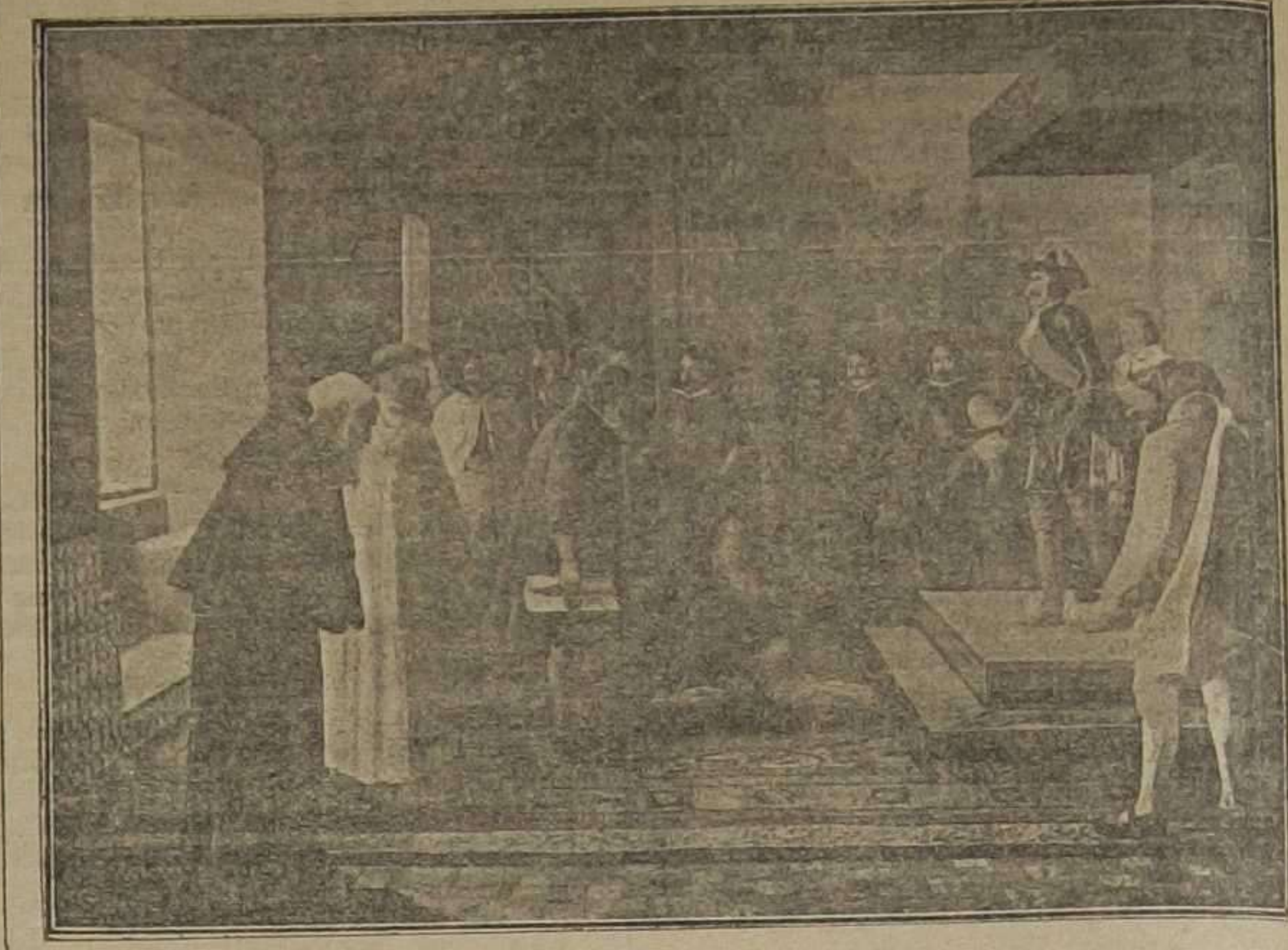
"Acompáñeme la ciudad" (Copia del cuadro de D. Esteban Alcantarilla, dedicado al Ayuntamiento de Utiel)