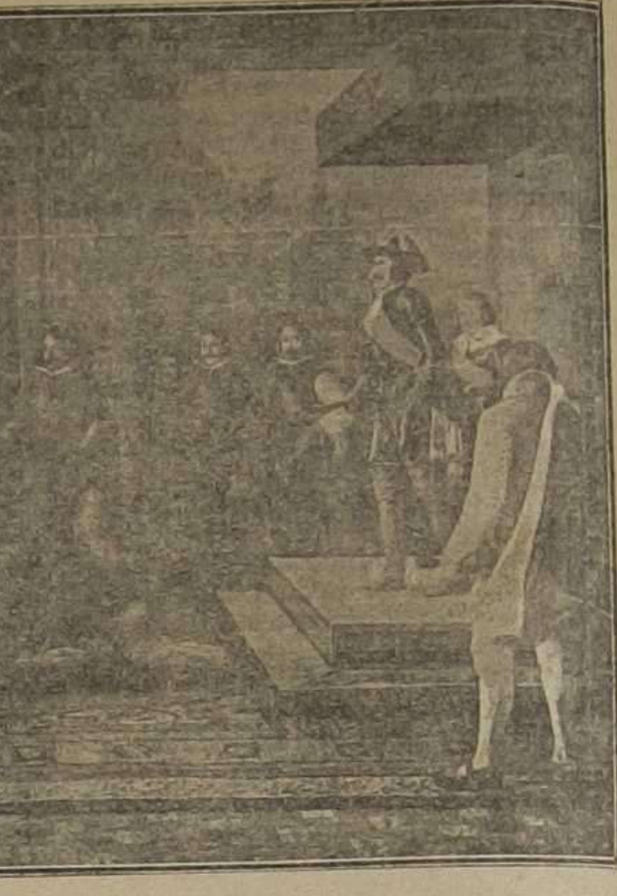
"Acompáñeme la ciudad" (Copia del cuadro de D. Esteban Alcantarilla, dedicado al Ayuntamiento de Utiel)