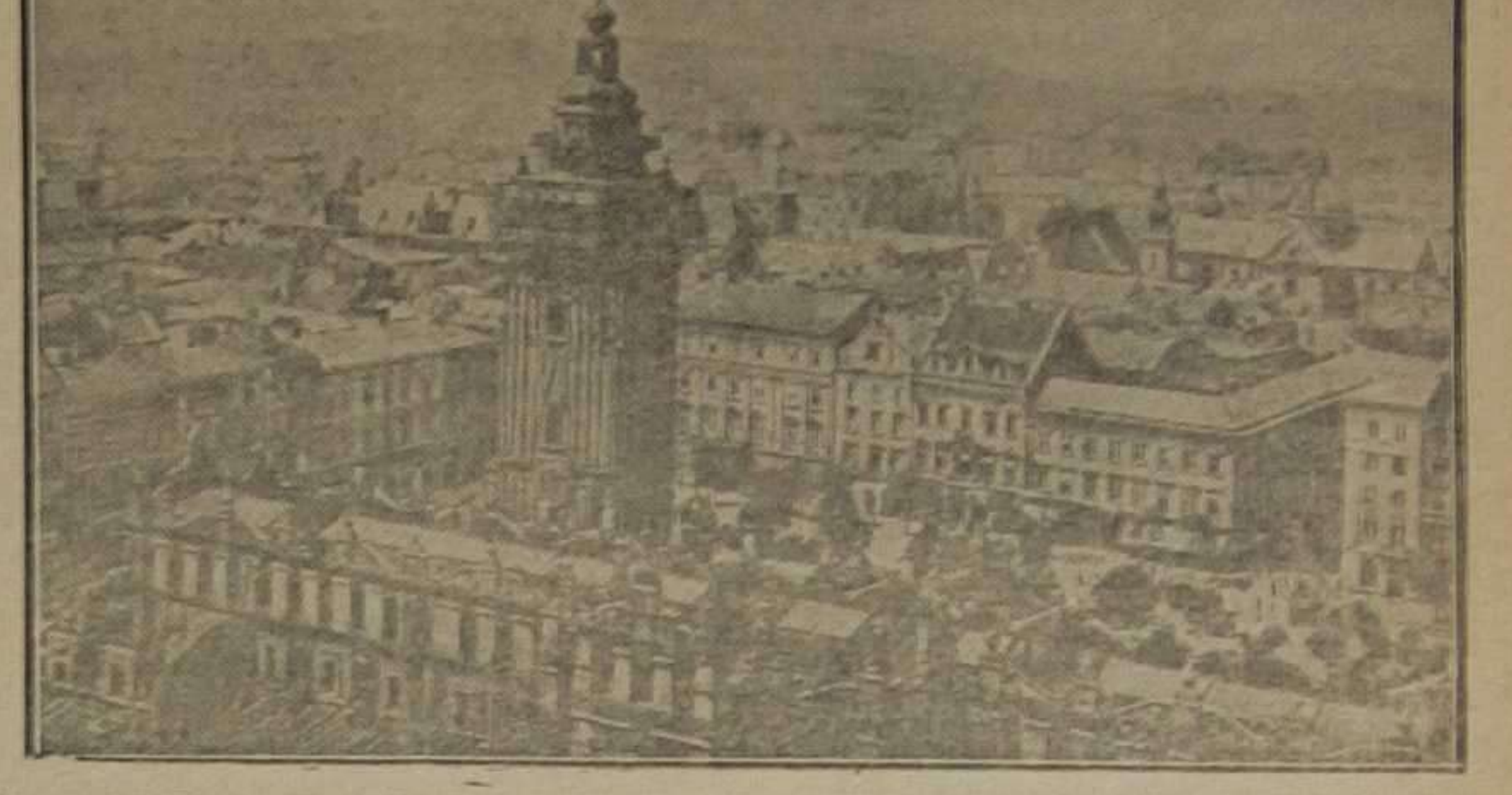
Vista de Cracovia. Al centro, la montaña del Vistula con fortificaciones formidables