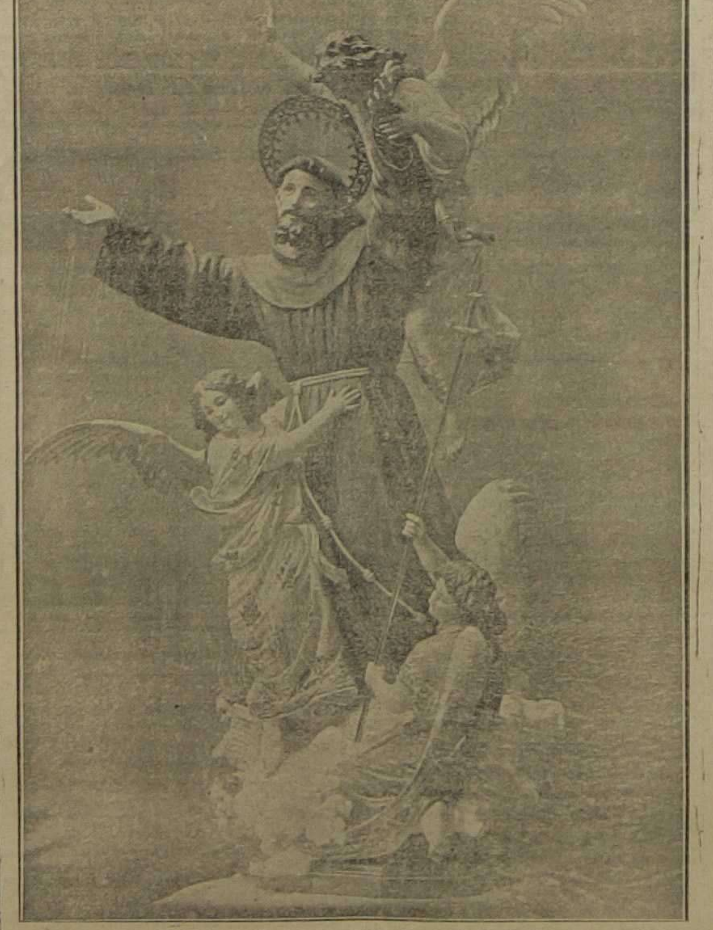
El Transito de San Francisco de Asis. Hermosa obra de arte del notable escultor D. Modesto Quilis, destinada al convento de Religiosas Clarisas de Ribadeo (Asturias)