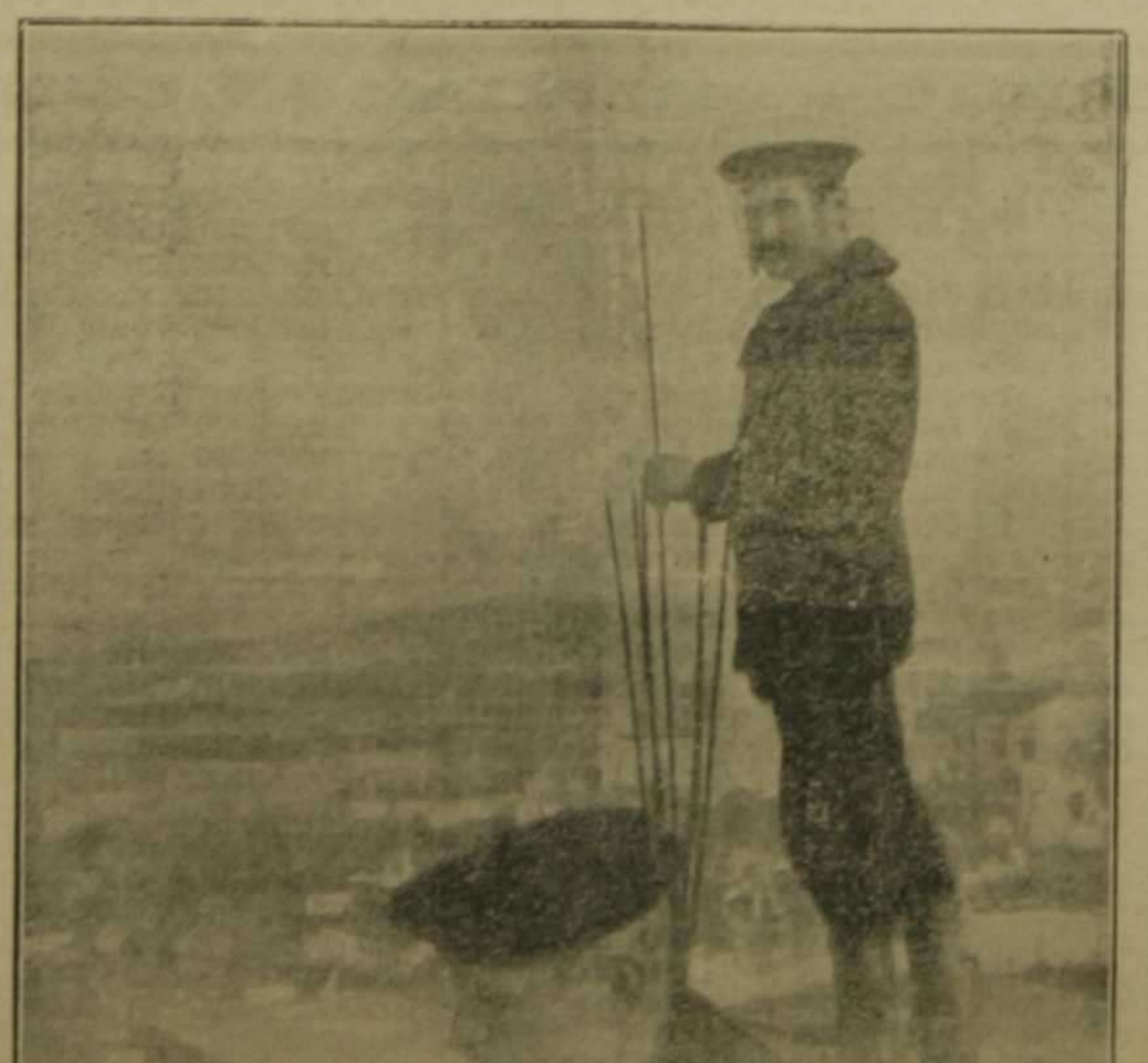
Un puesto de marinos alemanes en lo alto de la Catedral de Malinas, observando los efectos del cañoneo de los fuertes enemigos

He ahí los secretos de la política rapaz de los Estados Unidos.