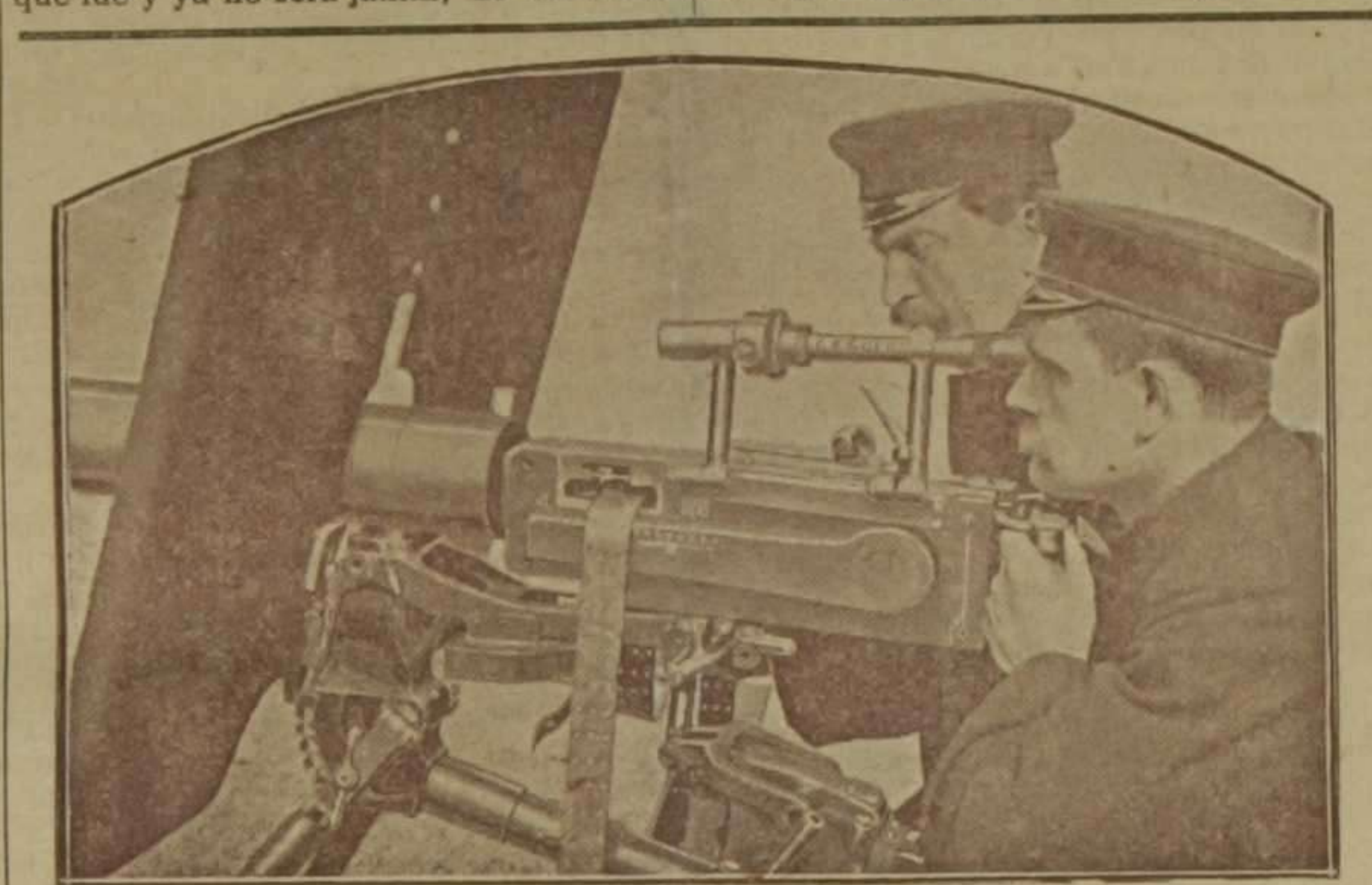
Telémetro de Goenz, colocado en una ametralladora con escudo protector del establecimiento Deutsche Waffennund Munitions fabriken

mente alcanzar fines culturales, pues la práctica nos demuestra constantemente y de un modo elocuente, el poco o ningún caso que se hace de la historia, como salvaguardia de la conducta individual y colectiva. Cree que hay que considerar los estudios históricos en el plano que les corresponde: como fruto de la emotividad sonora de la imaginación, gustosa de explasarse aspirando el suave aroma, romántico y triste, que destila el recuerdo de lo que fué y ya no será jamás; de un senti-