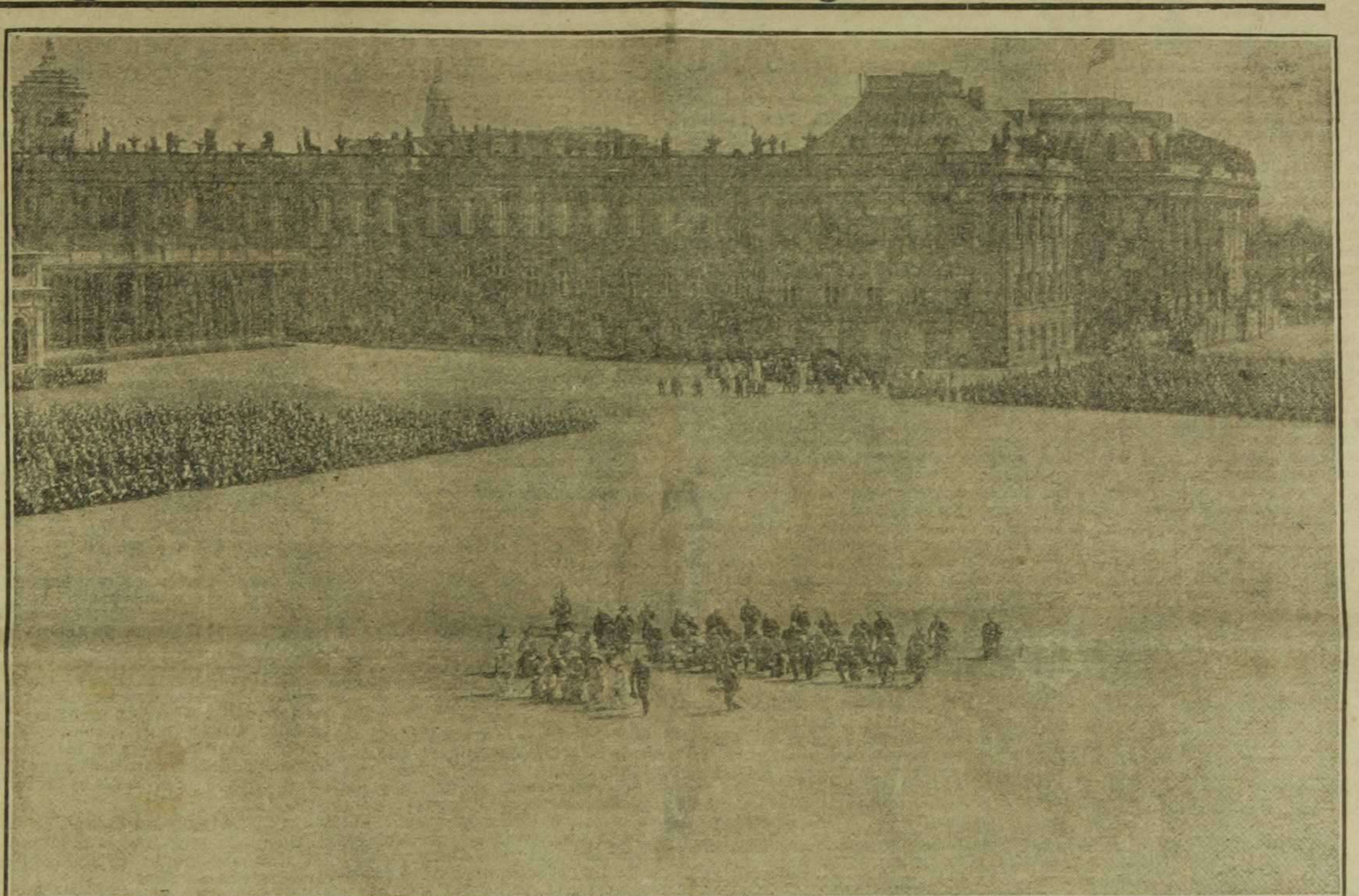
El kaiser Guillermo II de Alemania, con su esposa, sus hijos y su escolta, postrados de rodillas en la Misa de campaña celebrada en el magnífico y espacioso jardín de Luitgarten, en Potsdam, rodeado de las tropas de la guarnición, que, también de rodillas, asisten al Santo Sacrificio