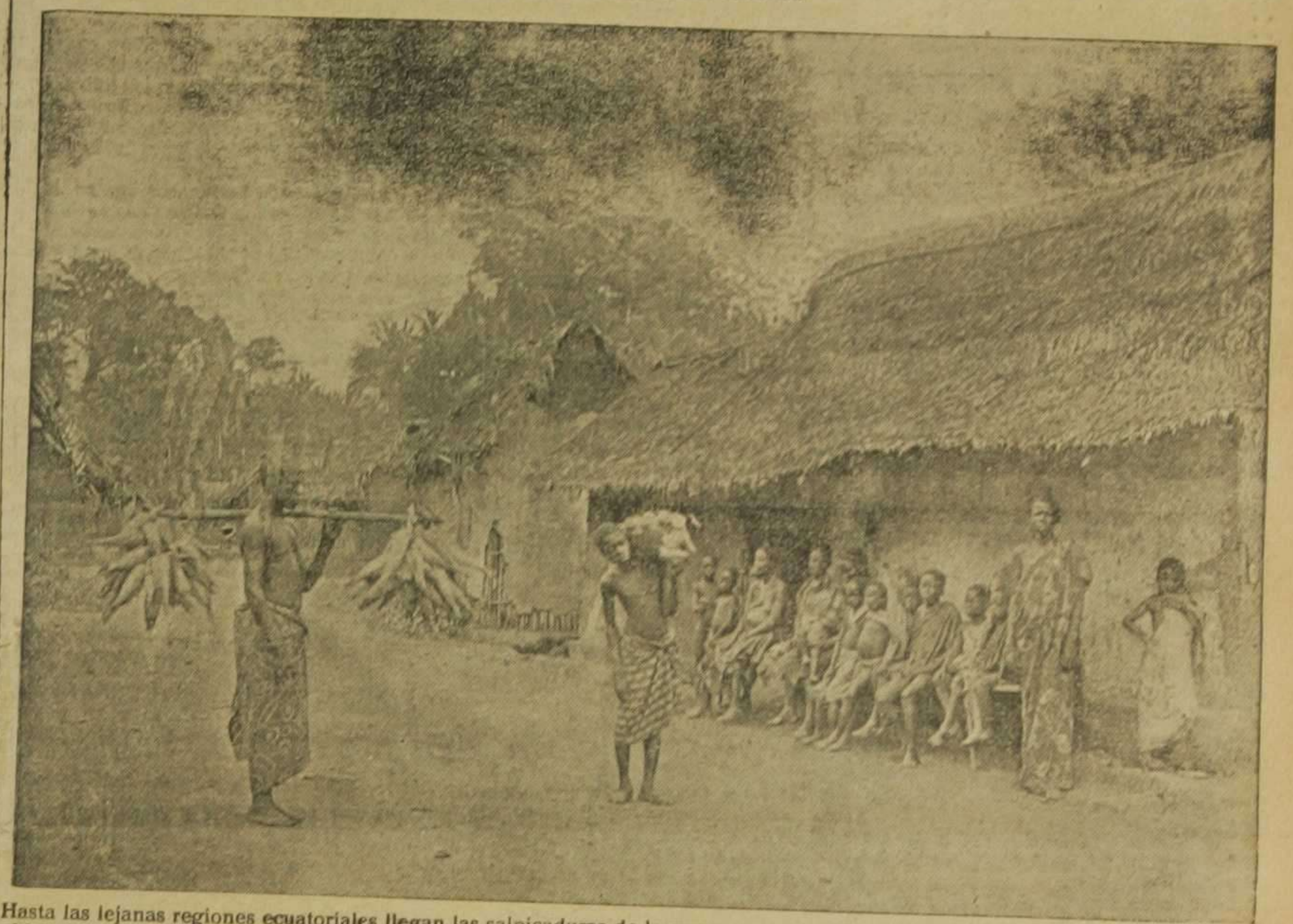
Hasta las lejanas regiones ecuatoriales llegan las salpicaduras de la guerra europea. Nuestro grabado representa una pequeña aldea de las posesiones alemanas de Togo, en el golfo de Guinea, que han sido atacadas por los ingleses. En esas posesiones la vida vegetal alcanza un desarrollo extraordinario, pero la vida humana es casi imposible bajo los rayos de un calor tropical del que no podemos formarnos idea ni aun en estos días abrasadores.

nuestra Madre, que es nuestra esperanza, tendrá conformidad en las penas, y en los mismos sepulcros no verá más que rosas, las rosas deshojadas de sus amarguras, según dijo el poeta: “Como rosas deshojadas y en un remanso esparcidas las penas de nuestras vidas se irán quedando olvidadas...” FRAY LUIS URBANO, O. P. Valencia 14 de Agosto.