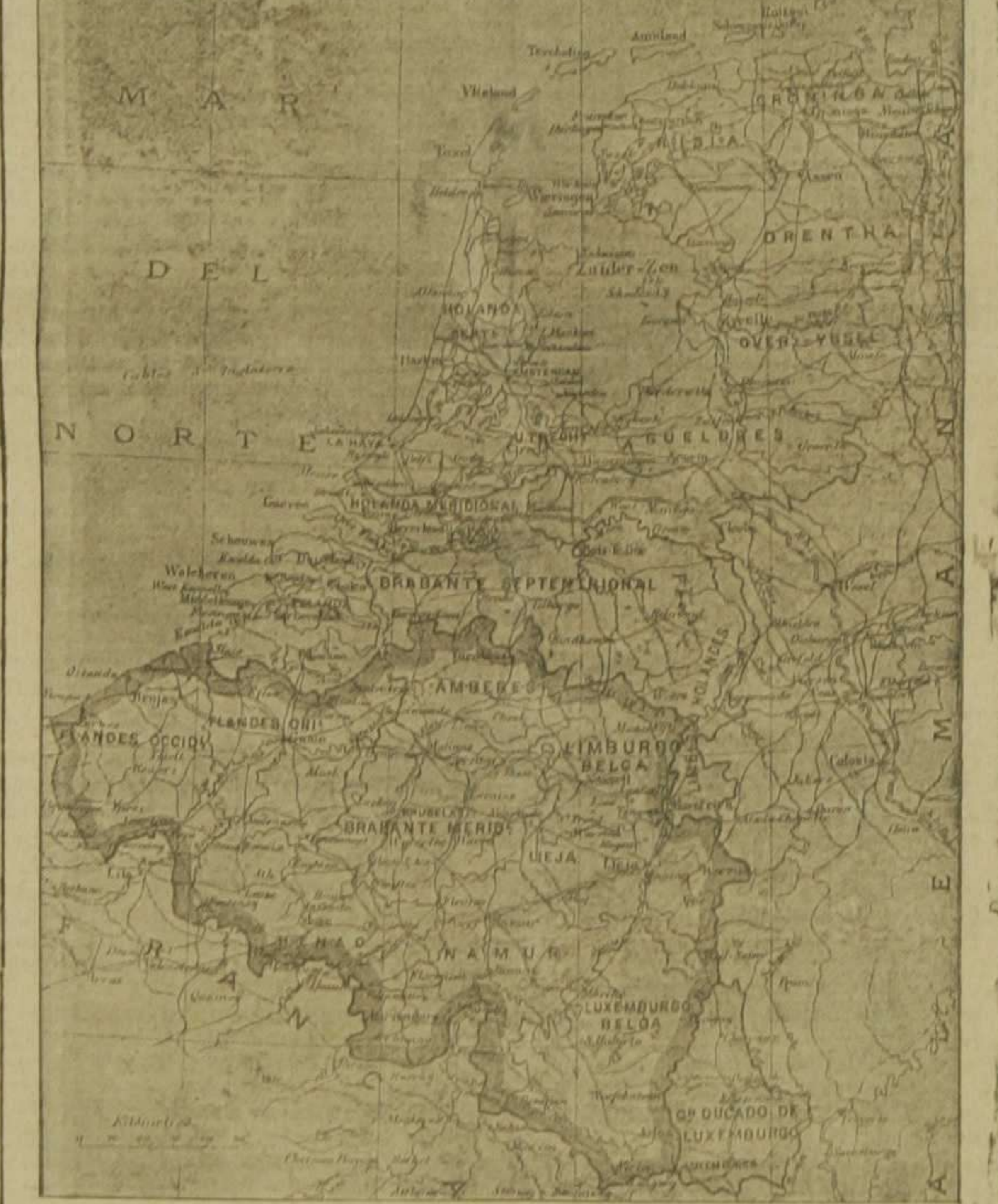
Mapa de Bélgica y Holanda, con el Gran Ducado de Luxemburgo y la frontera de Alemania. En él puede seguirse la marcha de las tropas alemanas y apreciarse los lugares de los primeros encuentros con toda facilidad

Dicen desde Berlín que el kaiser acentuó en su discurso el amor a la paz demostrado durante decenios por el pueblo alemán, y que, a pesar de la mala voluntad demostrada por los adversarios hacia Alemania, esta lucha es de defensa para