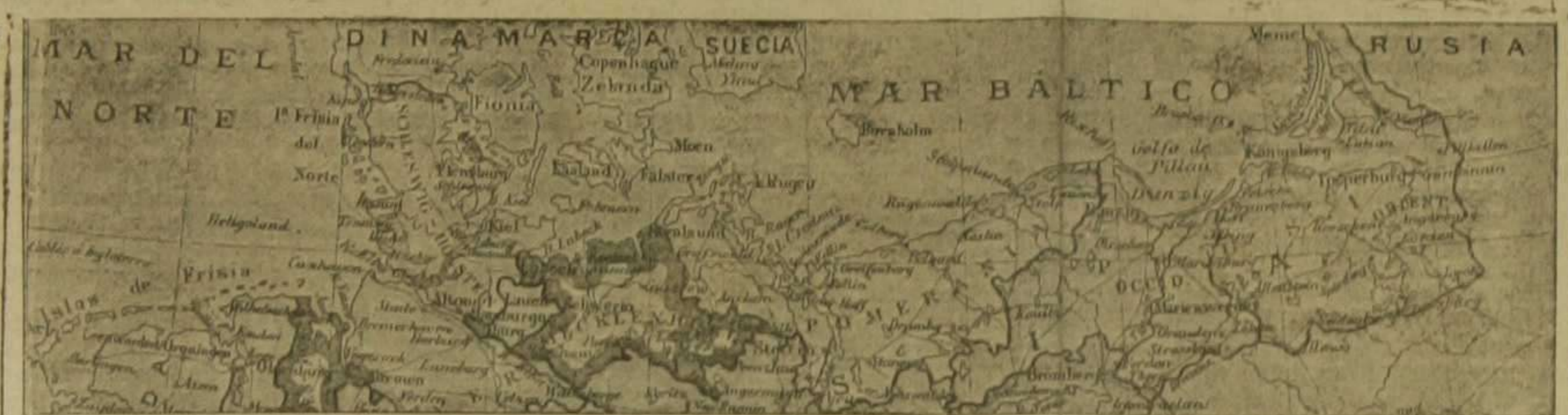
Mapa de las costas del Norte de Alemania, con los mares del Norte y Báltico, en donde chocarán las escuadras de las potencias beligerantes. La línea negra que va desde Kiel a la desembocadura del Elba, representa el canal del Emperador Guillermo, que permite a Alemania trasladar rápidamente sus barcos de uno a otro mar

No lo aplaudimos, pero tampoco nos escandalizamos hipócritamente. "En la guerra, como en la guerra", dice un refrán popular. Los débiles tenemos la contra de estar a merced de los poderosos; los que ahora se escandalizan de ese hecho censurable, serán los primeros que se aprovecharán de él el día de la liquidación definitiva.