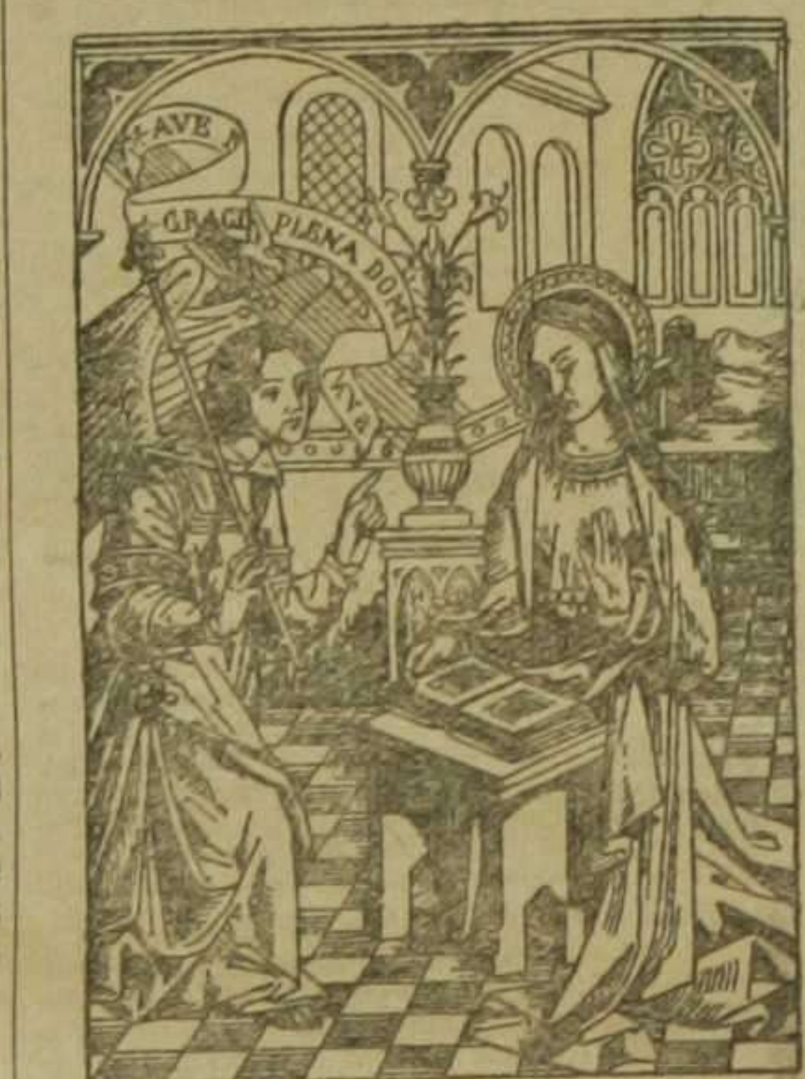
Gravat del segle XV, que va al front dels goigs a la Verge Maria, estampats en Valencia, sens loch ni nom d' impresor.