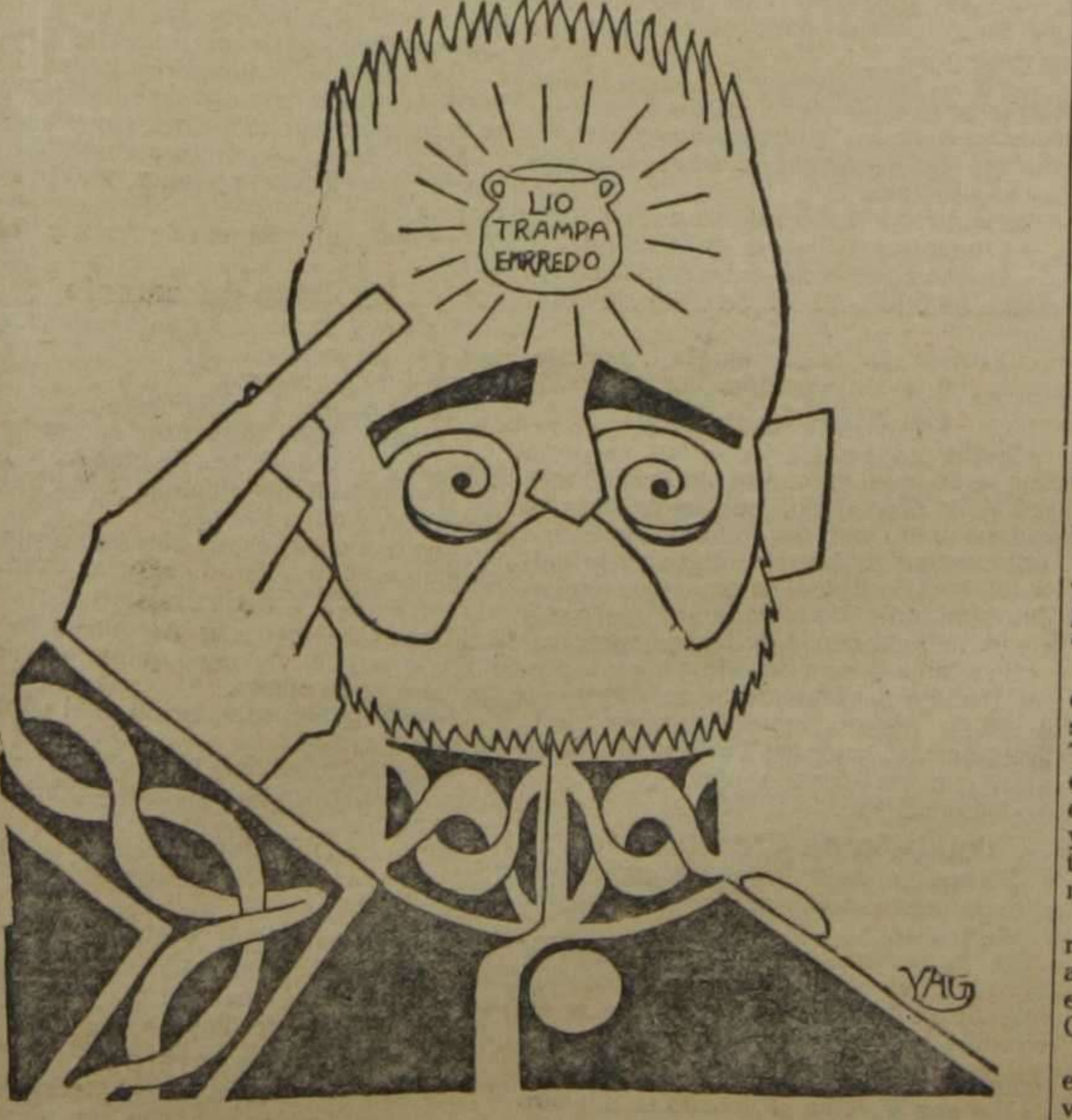
Gracias a mi calete hemos constituido el Congreso con una mayoría muy decorosa...