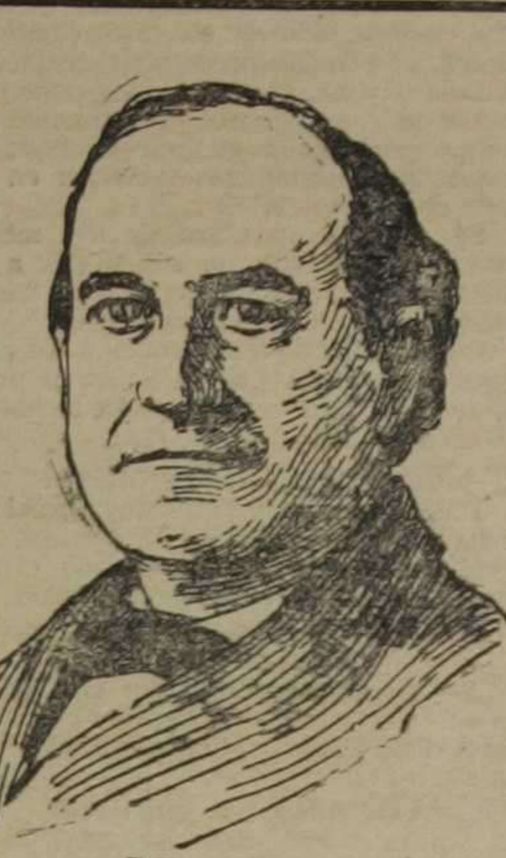
Mr. Bryan ministro del Exterior de los Estados Unidos, al que Mr. Wilson culpa de la agravación del conflicto yanqui-mejicano (POR TELEGRAMA) Madrid, 29.