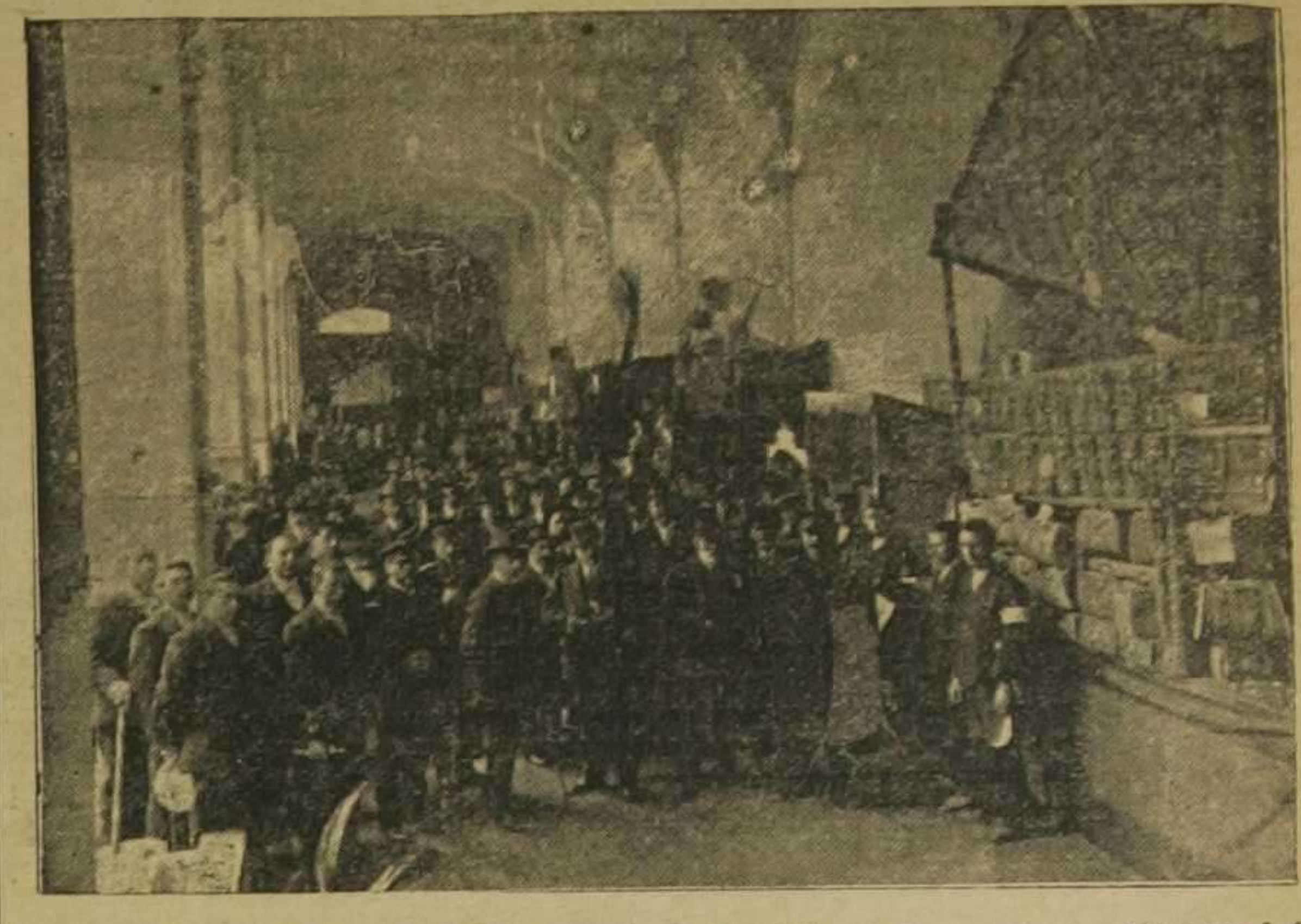
Inauguración de la Exposición de trabajos industriales de los reclusos del penal de San Miguel de los Reyes.