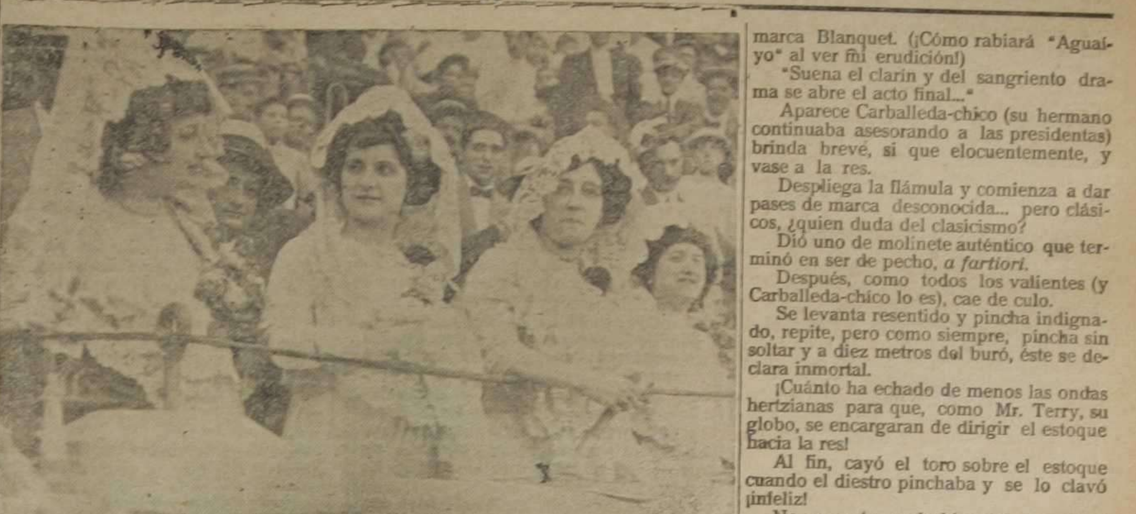
Las presidentas de la corrida

Oh, manes de Pepe-Hillo, Domínguez, Pablo Romero, Costillares, Tato, Lagartijo y Frasuelo! ¡Regocijaos en vuestros sepulcros al ver que aún quedan generaciones que os comprenden; genios que resucitan aquel sublime arte de que fuisteis habilitados intérpretes; genios que reivindicando los fueros de la fiesta nacional, desmintiendo los sofismas taurómacos de esos lipendis de la torería andante, de esos pseudo-fenómenos, de esos acróbatas, de esos bailarines de la noble profesión, de esos Bomba I, II y III; Gallo I, II y III; Machaco y Machaquito, Fuentes, Pastor, Cocherito de Bilbao y tantos otros que adulteran las suertes magníficas, las incomparables lances que os dieron gloria, dinero y reputación universal.