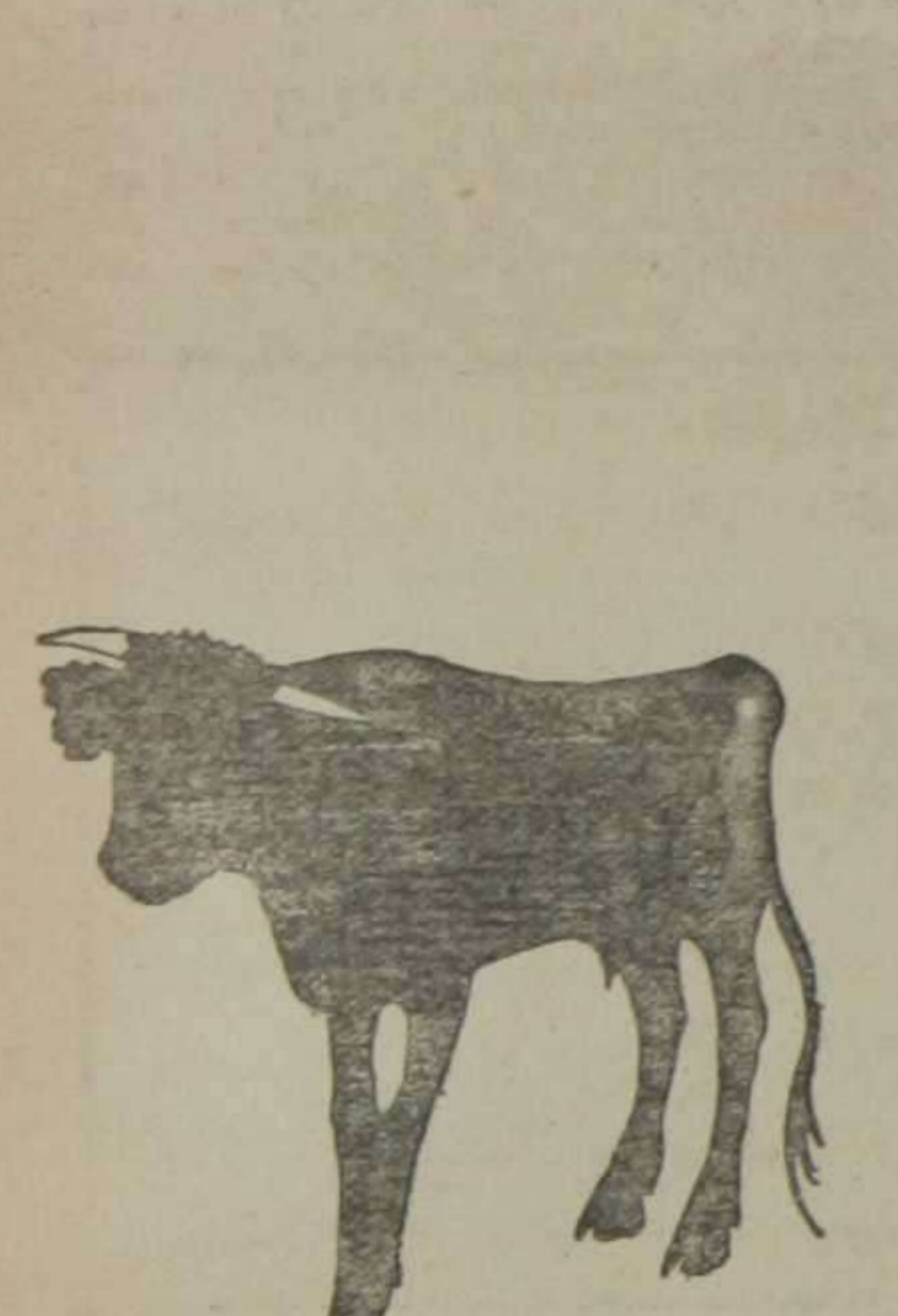
Así era mi tercer toro, en los corrales