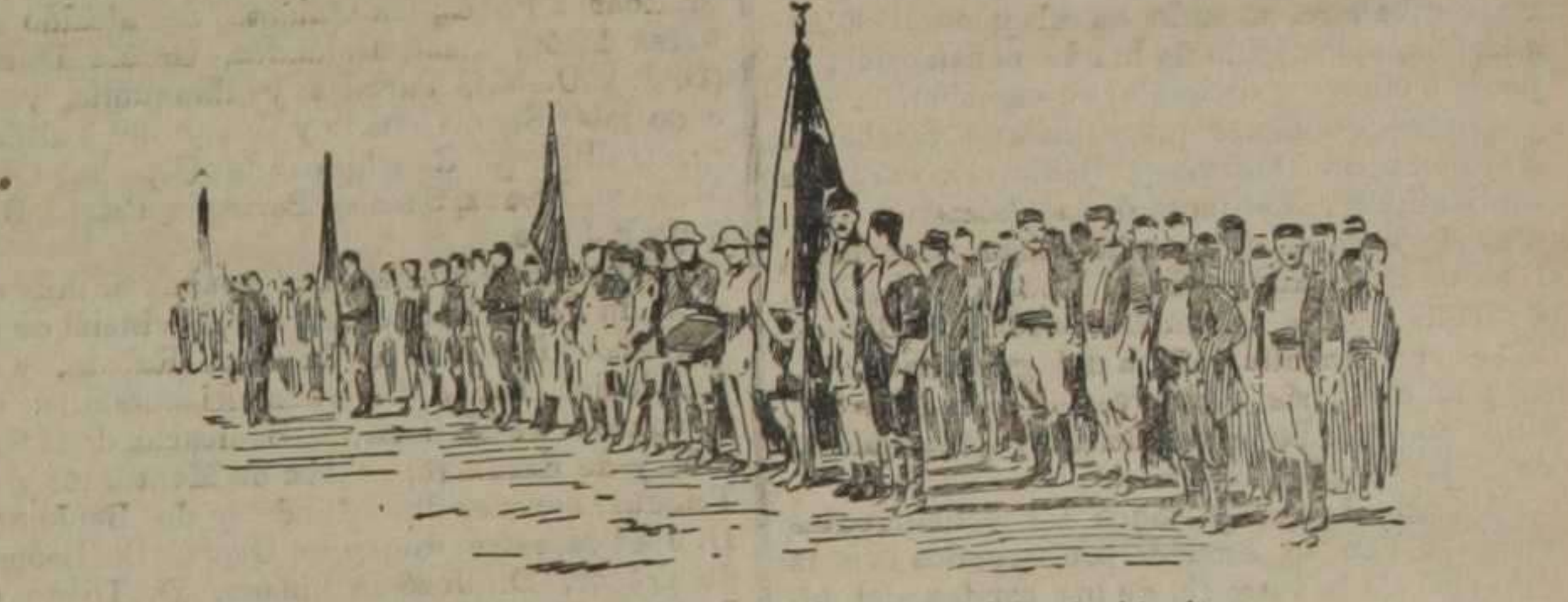
Voluntarios macedonios incorporados al ejército búlgaro en las líneas de Tchataldja.

tencias ejercerán presión sobre los Estados balcanicos, para que no sigan manteniendo sus exageradas exigencias, que Turquía no puede aceptar.