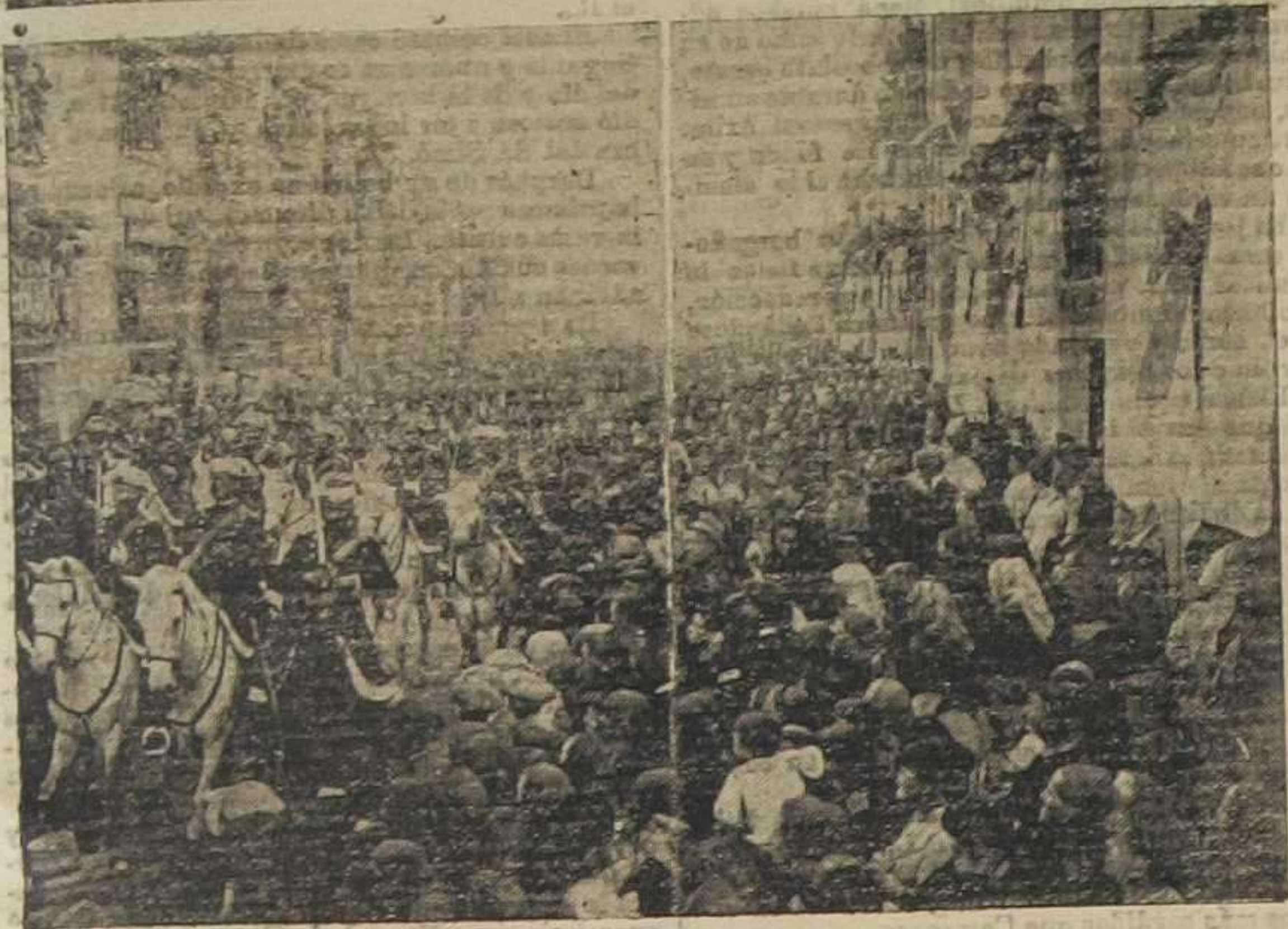
En señal de duelo

Anoche se suspendieron los espectáculos y el día de mañana en señal de duelo, y durante el día de mañana los comercios por la misma causa.