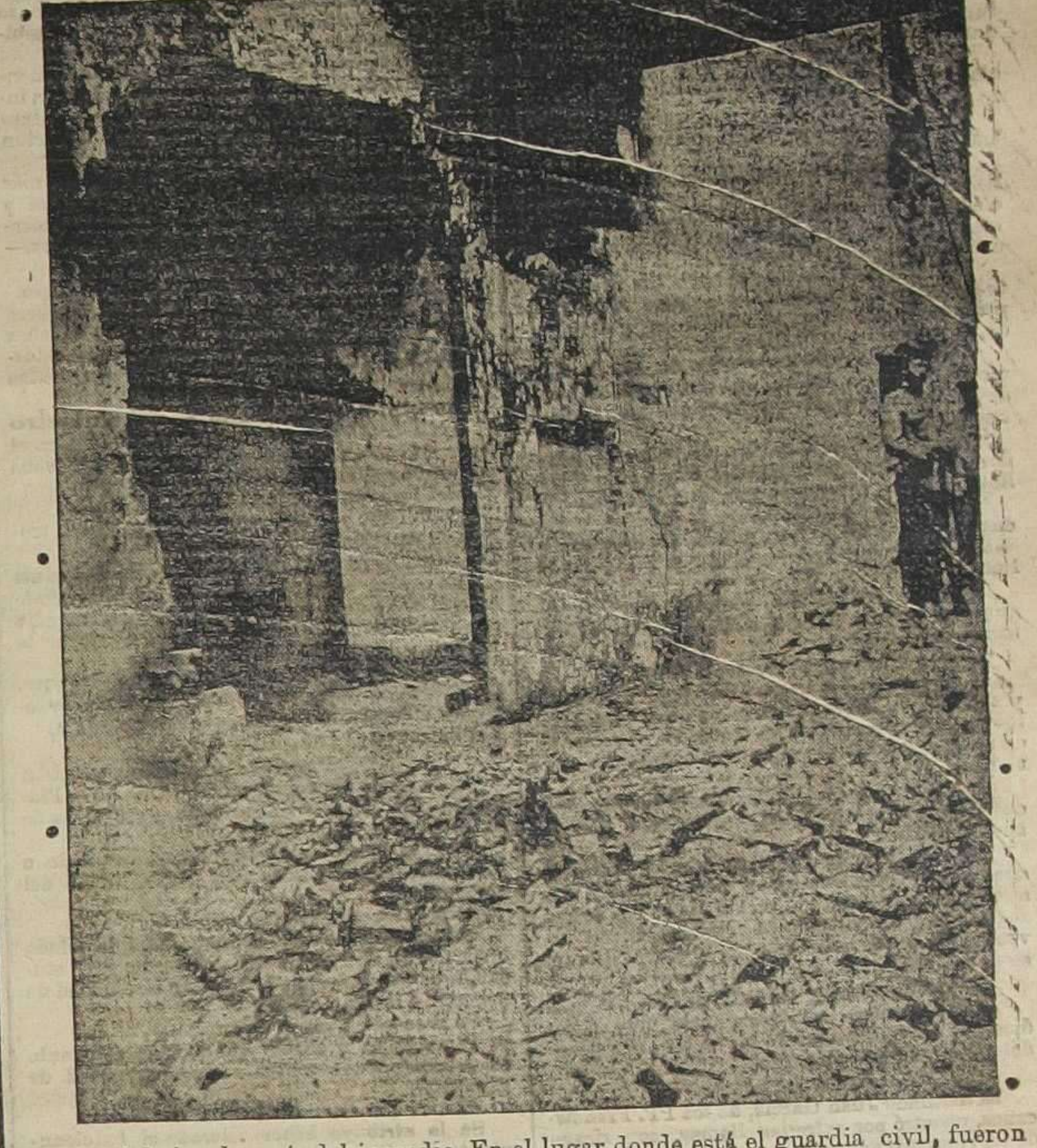
Interior del cine después del incendio. En el lugar donde está el guardia civil, fueron encontrados 43 cadáveres amontonados

La dirección, gerencia, redacción y administración del DIARIO DE VALENCIA suplican a sus suscriptores, lectores y amigos y a los católicos en general que asistan a alguno de dichos actos religiosos, rogando a Dios por el eterno descanso de las víctimas de tan luctuoso suceso,