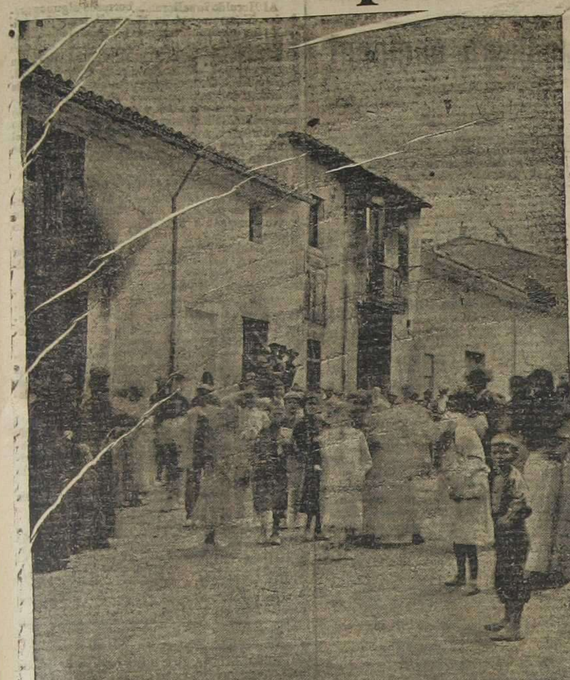
Fachada del edificio incendiado

Ciento treinta y seis heridos asistidos en el Hospital y en las farmacias. --Otros heridos y contusos se han curado en sus domicilios Son culpables las autoridades por su negligencia