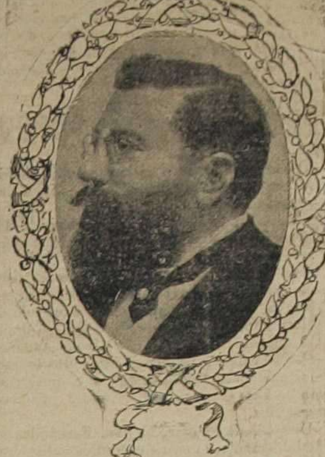
D. Juan Vázquez de Mella