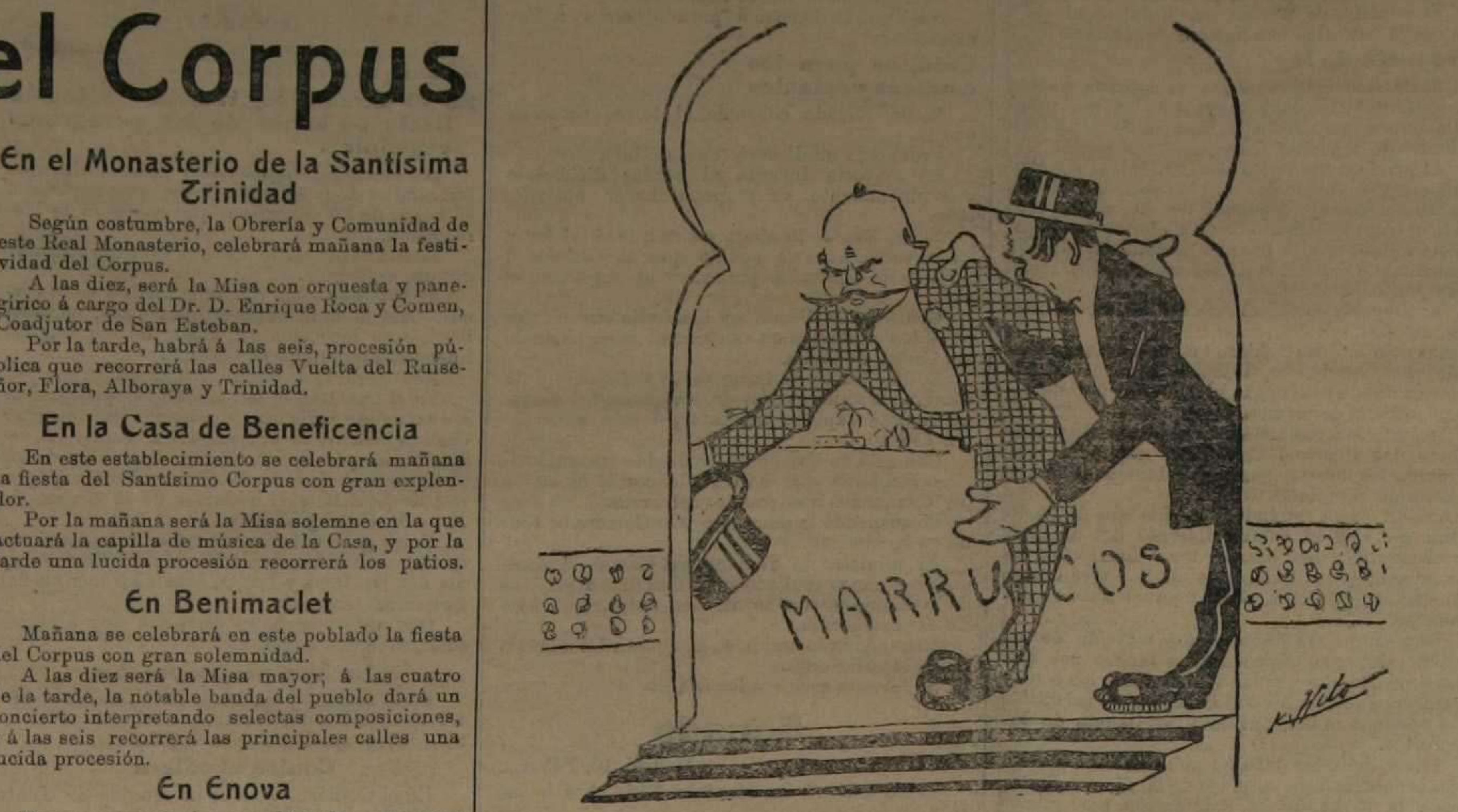
El español.—Salga V. delante. El francés.—No, V. primero.