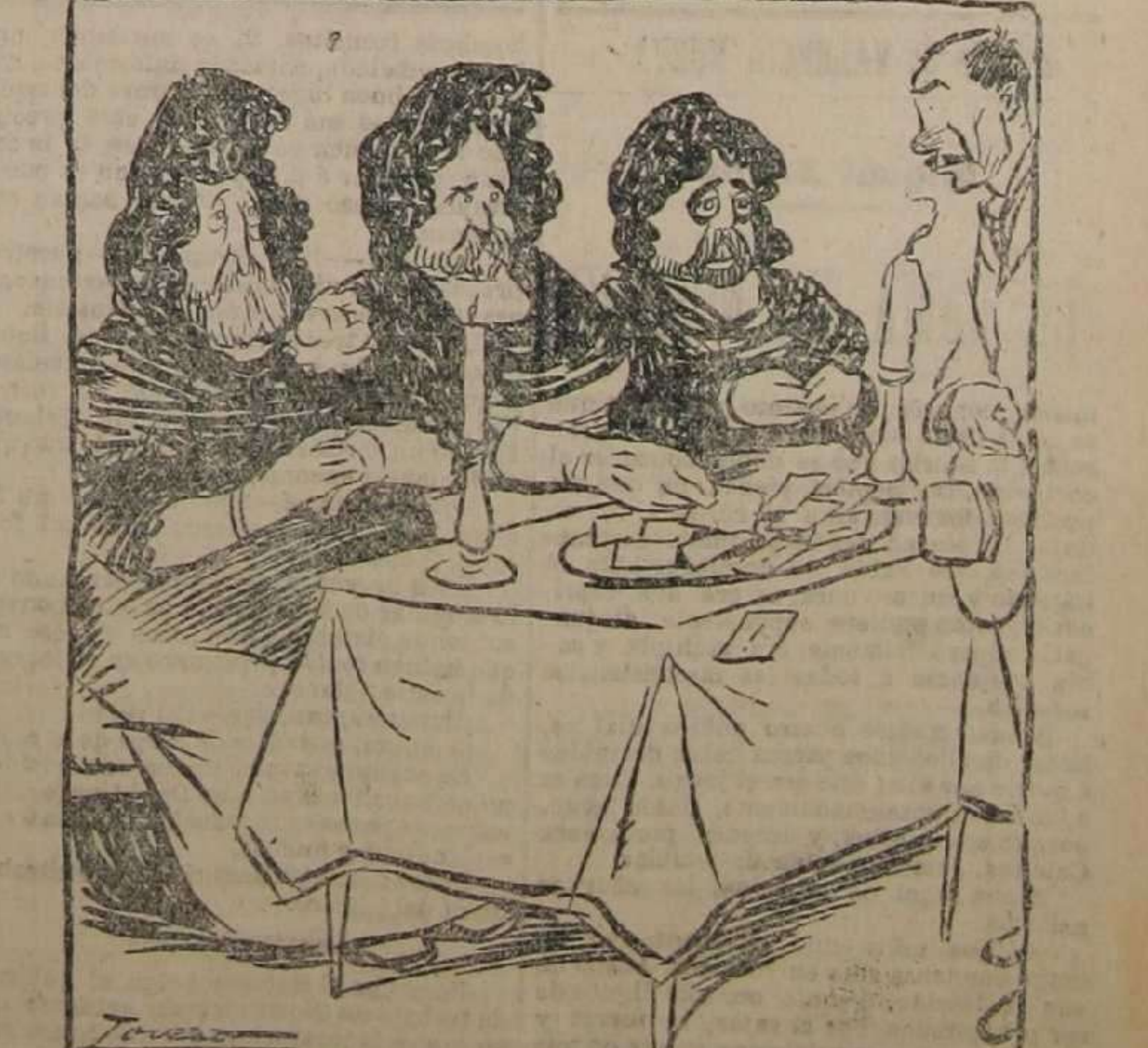
El único que deposita en la bandeja, son peticiones para figurar en el cenillado oficial.