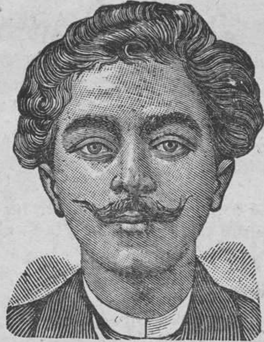
Después de 15 días de tratamiento