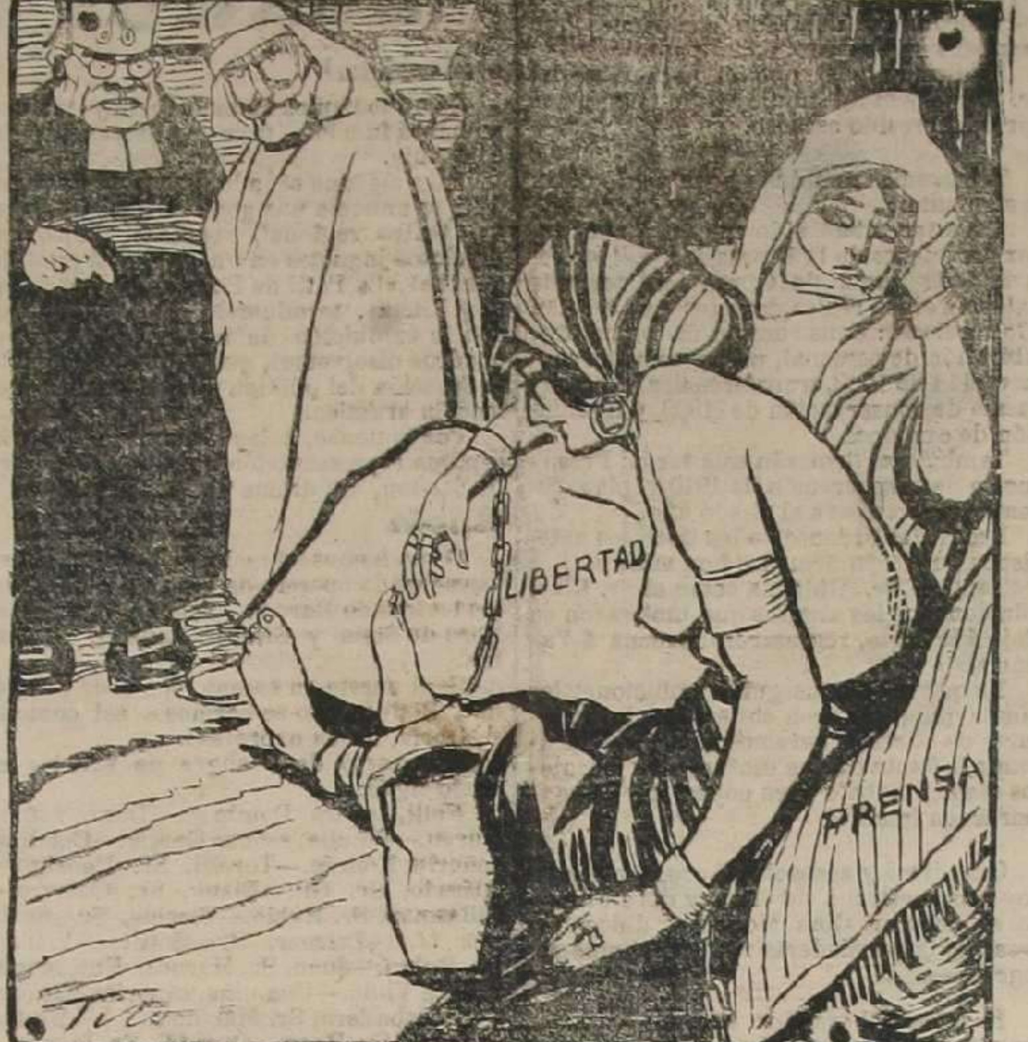
Por fin te logre amarrear a inútiles son tus quejas, es en vano tu clamor y es imbécil confiar ni en el propio Canalejas.

donde se los trabaja repartiendo invitaciones para el mitin y encargando a los dueños de los mismos que acudan y hagan acudir a tantos cuantas invitaciones hayan entregado, sea de retirados o de protección. ¿Puede haber algo más despreciable, más bajo, que representar más abyección? Los que se nieguen a cooperar al éxito de la farsa del domingo, se quedarán sin pan.