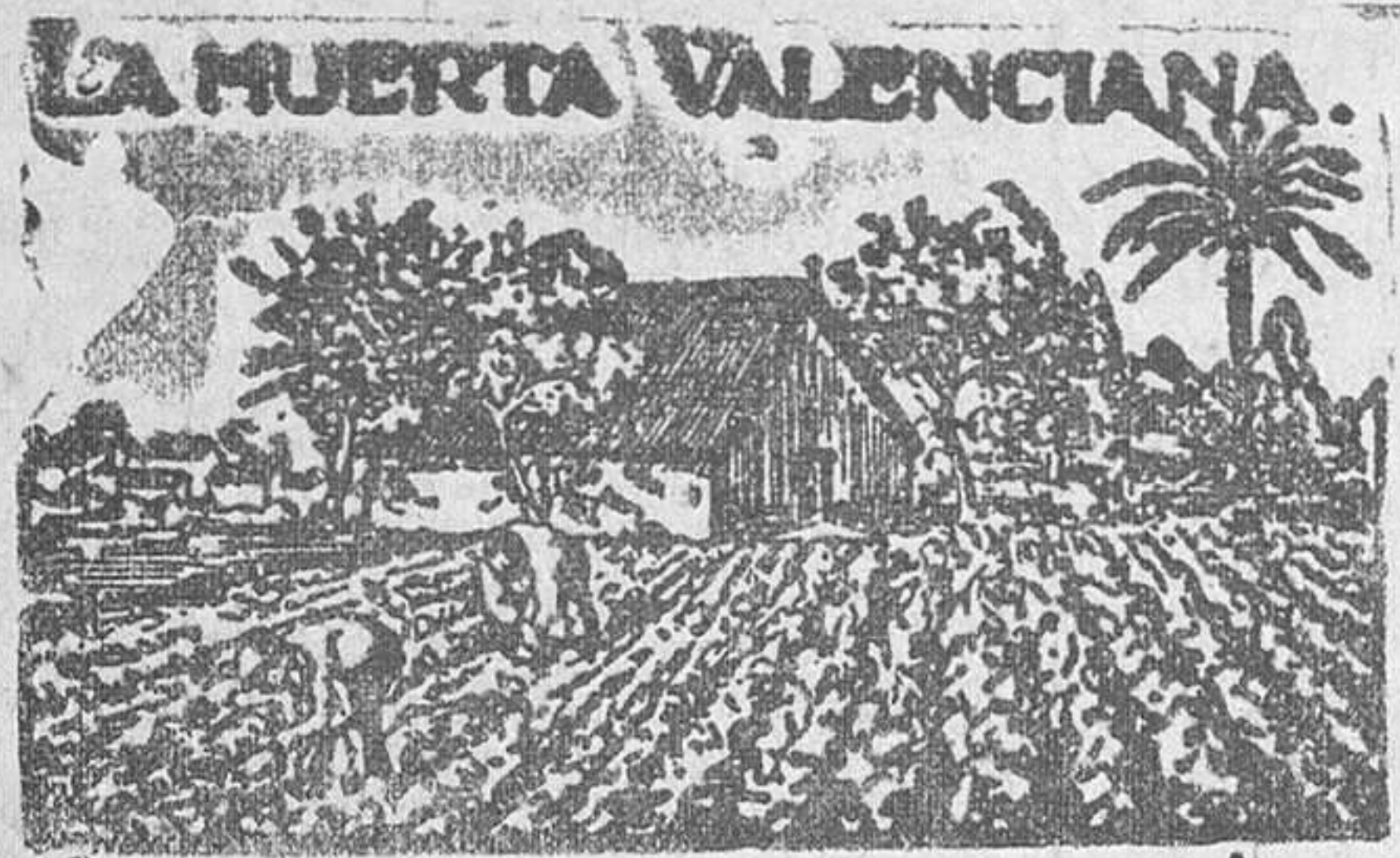
En la calle de la Linterna, numero 21, entresuelo, barato de tejidos de