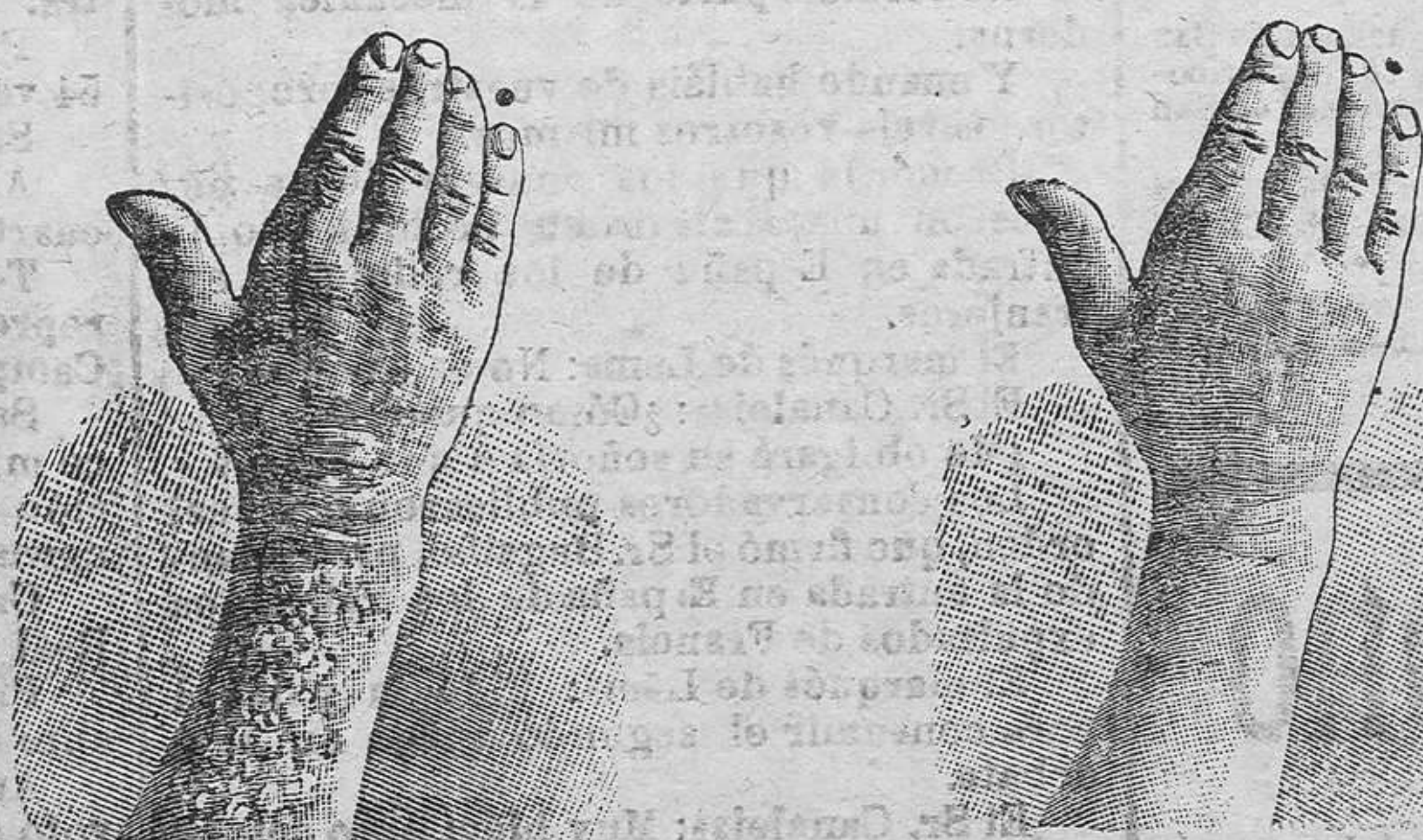
Antes de la ocración