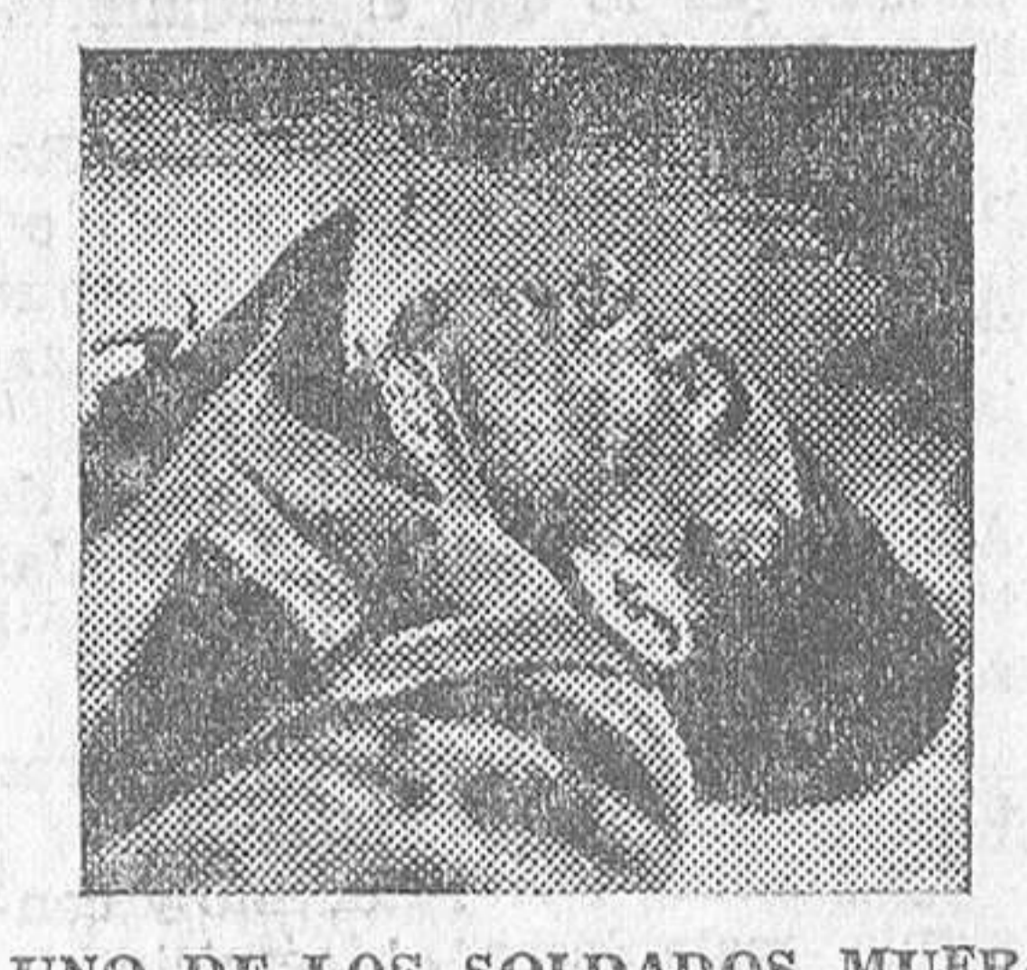
UNO DE LOS SOLDADOS MUERTOS EN EL PASEO DE RECOLECTOS

Este mediodía se han reproducido las manifestaciones al conocerse la noticia de la detención de Sanjurjo, y los grupos han prendido fuego al convento de San Leandro, situado en la plaza del mismo nombre. Se enviaron auxilios, y las autoridades tratan a todo trance de restablecer la normalidad.