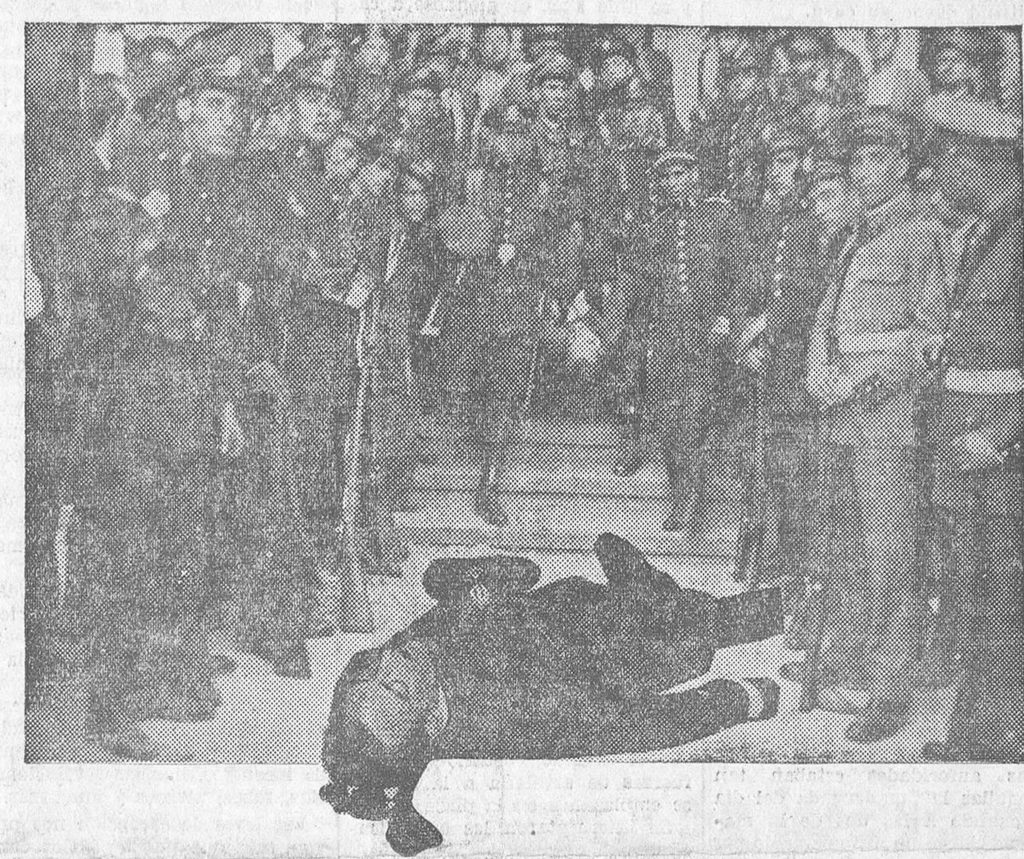
LAS FUERZAS DE SEGURIDAD Y ASALTO TRANSPORTAN LAS VICTIMAS A LOS COCHES AMBULANCIA. EN PRIMER TERMINO EL CADAVER DEL OFICIAL MUERTO DURANTE EL TIROTEO

Sevilla. — Esta madrugada llegaron con el general Ruiz Trillo las tropas y algunos periodistas. Estos han teleografiado diciendo que a las diez de la noche comenzó a cundir el desaliento a consecuencia de las proclamas lanzadas por los aviones leales al Gobierno. Se celebró una reunión de coroneles, los cuales marcharon a conferenciar con Sanjurjo, a quien dieron cuenta de que no podían contener a la guarnición y habían decidido rendirse por no poder ayudarle. Sanjurjo les expuso su pretensión de salir con una columna hacia Carmona y Lora del Río, para volar un puente y esperar a las tropas que habían salido de Madrid y que estaban ya concentradas en Córdoba para iniciar a las ocho de la mañana de hoy el avance sobre Sevilla. Los coroneles se opusieron rotundamente. Entonces Sanjurjo, visiblemente molesto, marchó a la base aérea de Tablada, donde intentó huir en un avión, pero parece que la oficialidad de aquella base se negó a facilitarle la huida. Sanjurjo marchó entonces al palacio de los marqueses de Esquivel, donde se cambió de ropa,