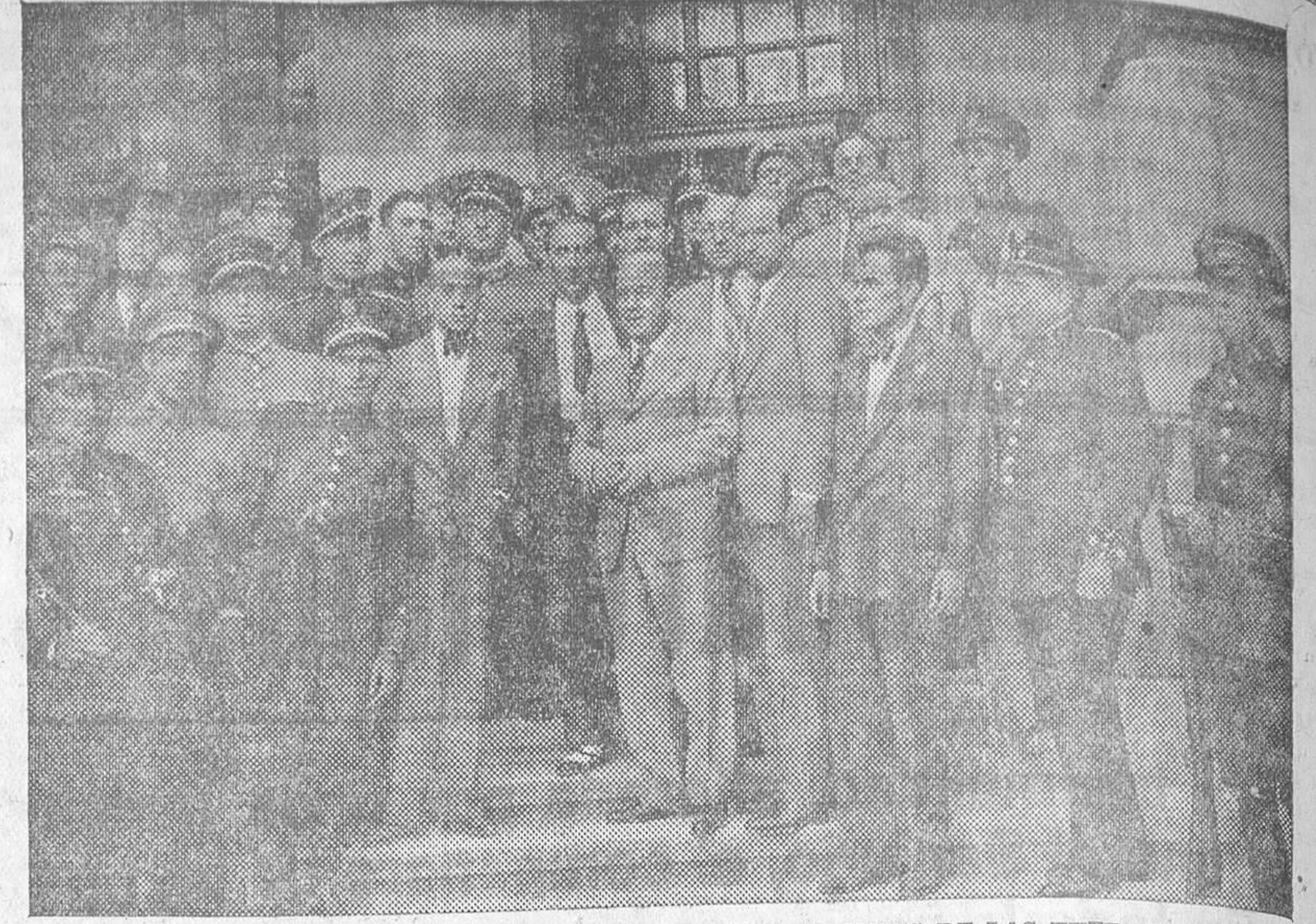
EL DIRECTOR GENERAL DE SEGURIDAD, PERIODISTAS Y JEFES DE LAS FUERZAS, REUNIDOS CUANDO YA SE HABÍA DOMINADO LA SITUACION.

San Sebastián.—Ha sido detenido José Antonio Primo de Rivera, hijo del general del mismo apellido, al intentar transarar la frontera.