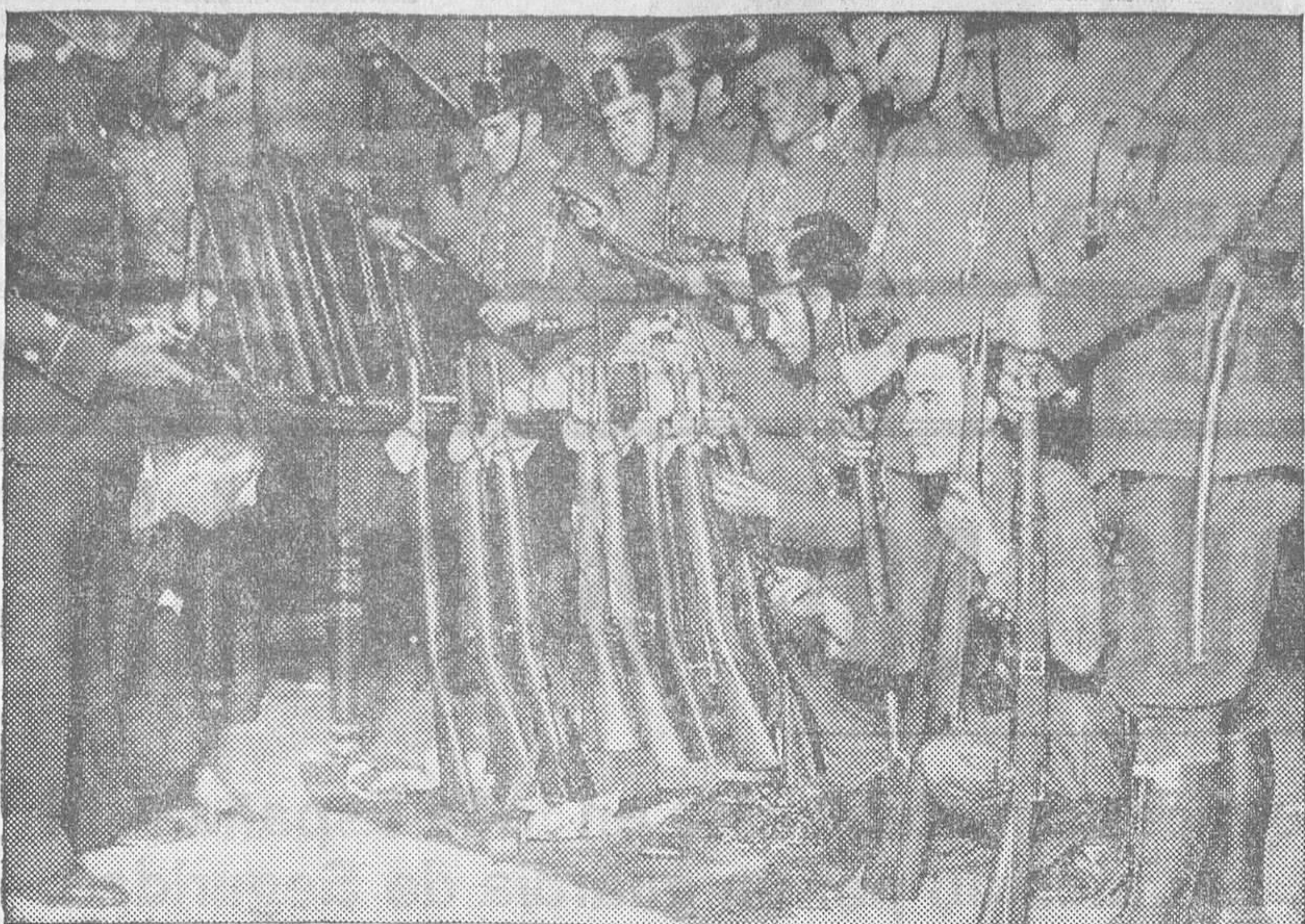
FUERZAS DE GUARDIA CIVIL Y ASALTO CONTEMPLANDO LAS ARMAS OCUPADAS A LOS REVOLUTOSOS.

Guadiana, que disparó contra la multitud desde su casa.