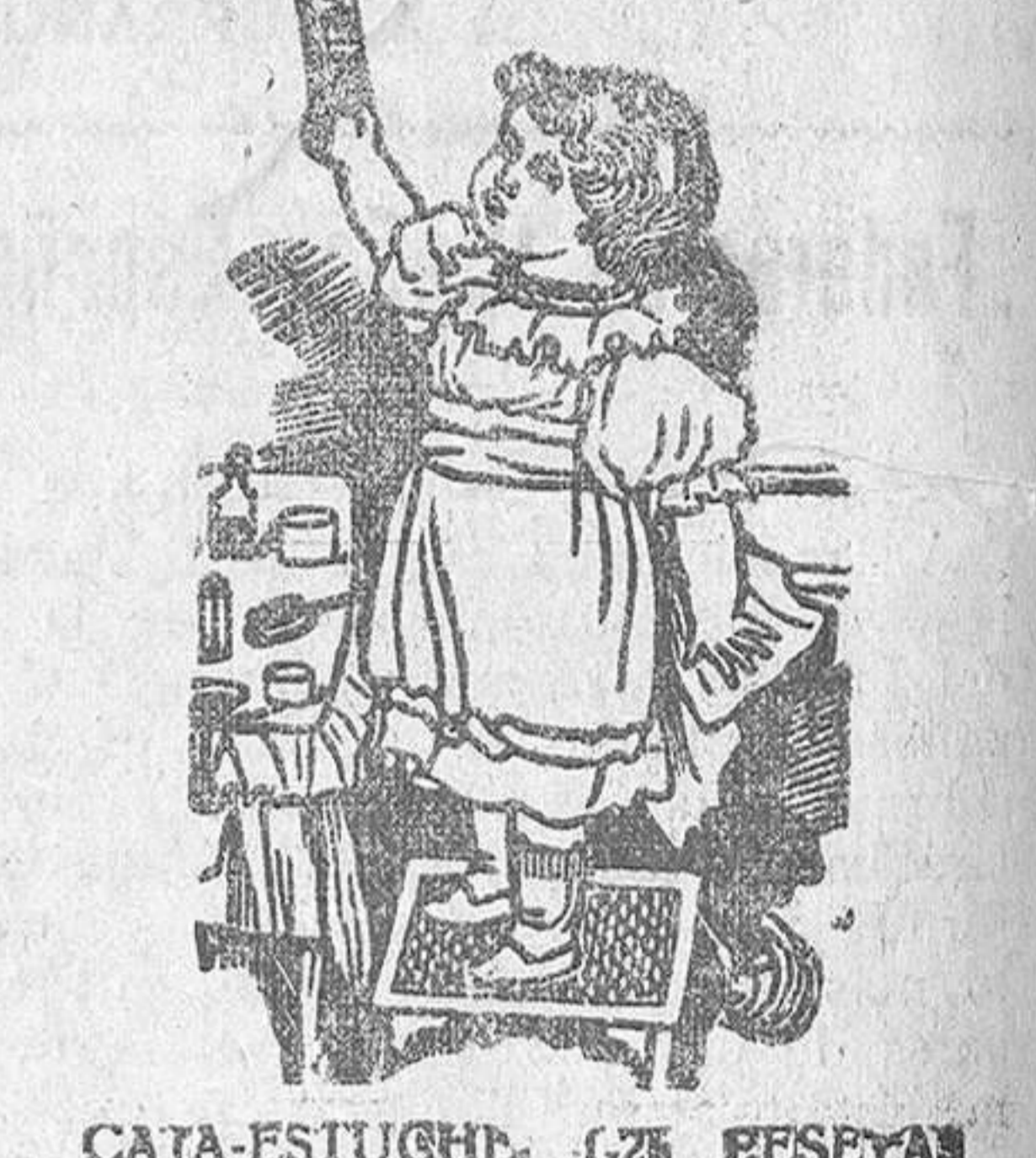
CAJA-ESTUCHE, 1,25 PESETAS

—¿Un tercio?— preguntó Zirafa— ¿Una onza treinta y tres? —Menos, sí; más, no. —Está bien—dijo don Loló—. Valga tu palabra y dame diecisiete liras. —¿Qué?—preguntó el tío Dimas como si no hubiese entendido. —Yo rompo la tinaja para hacerte salir—prosiguió don Loló—y tú, dice el abogado, me la pagas en lo que vale: una onza y un tercio. —¿Pagar yo?—dijo el tío Dimas riéndose á carcajadas— ¡Usted, bromea! Aquí estoy hasta que se me coman los gusanos. Y sacando del bolsillo, con alguna calma, la pipa, repleta, la encendió y se puso á fumar, tirando el humo por el cuello de la tinaja. Don Loló quedó perplejo. Este otro caso, el de que el tío Dimas ya no quisiera salir de la tinaja, ni el ni el abogado lo habían previsto. ¿Y cómo se resolvía entonces? Estuvo á punto de ordenar de nuevo: «¡La mula!» Pero se contuvo á tiempo, pensando que ya era de noche. —¿Ah, sí?—dijo— ¿Te quieres domiciliar en mi tinaja? ¡Testigos todos los que estás aquí! El no quiere salir para no pagarla; yo estoy dispuesto á romperla. Por tanto, puesto que quiere estar ahí, mañana yo le cito por abuso de alojamiento y porque me impide utilizar la tinaja. El tío Dimas echó una nueva bocanada de humo por el cuello de la tinaja y luego replicó, pídicamente: —No, señor. No quiero impedir nada. ¿Es que estoy aquí por placer? Hágame salir y me voy contento. ¡Pagar... ni en broma, señor!