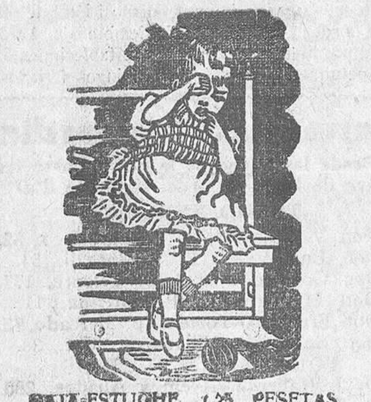
CAJA-ESTUCHE, 1,25 PESETAS