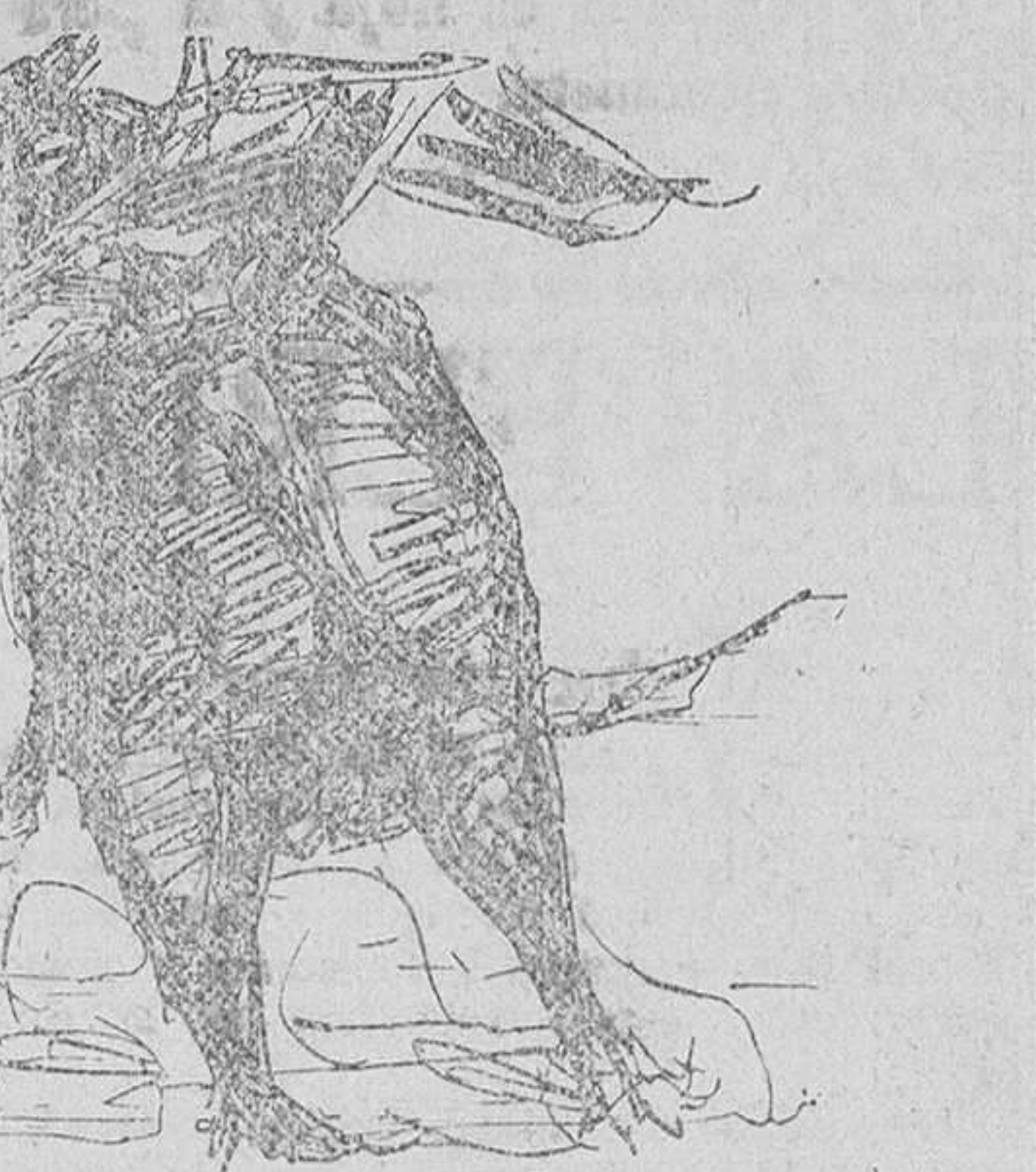
Lalanda, trasteando a su segundo toro

Garrigues, núm. 6, casa Ramón; San Vicente, 168, casa El Blanco; Cervantes, 14, casa Victoriano; Don Juan de Austria, 3, Vicente Olmos; Félix Picueta, 12, casa Clavel.