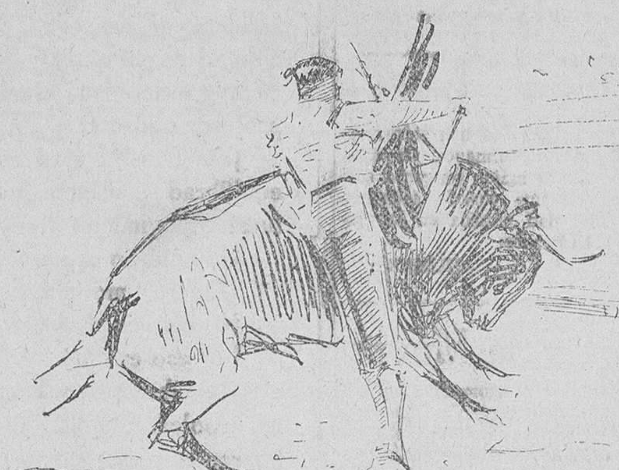
Algabeño, en su segundo

El Benalía y el Bellas Artes no son admitidos en este grupo por anterior conducta observada por estos clubs.