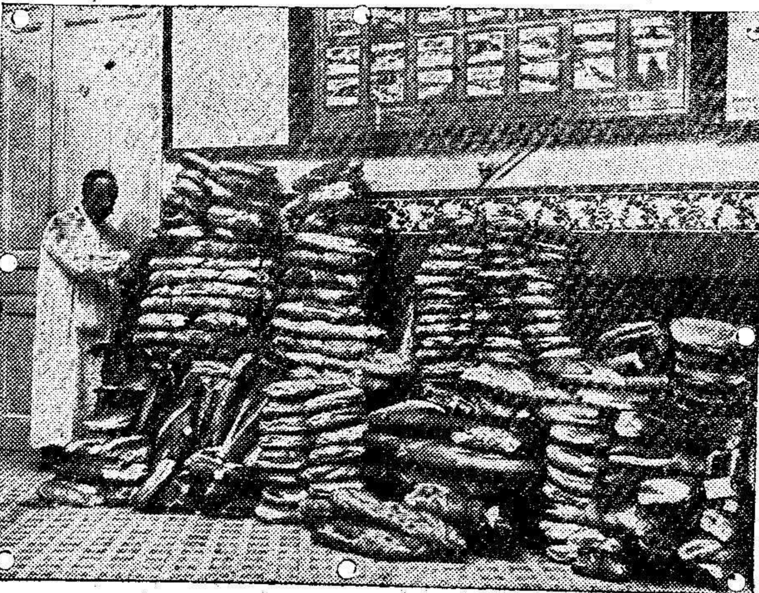
Muestras de pan llevadas al Laboratorio Municipal, de Madrid

Por otro edicto se hace saber que durante un plazo improrrogable de tres meses se admitirán reclamaciones contra la inscripción solicitada por la Sociedad en Comandita Jorba y C.ª, de una finca rústica, sita en Anohir, en las inmediaciones de la estación de la Compañía Española de Minas del Rif, de una hectárea aproximadamente de extensión superficial. Esas reclamaciones podrán hacerse ante el Registrador, en la Comandancia General de Melilla, y en la oficina del Kadi de Nador.