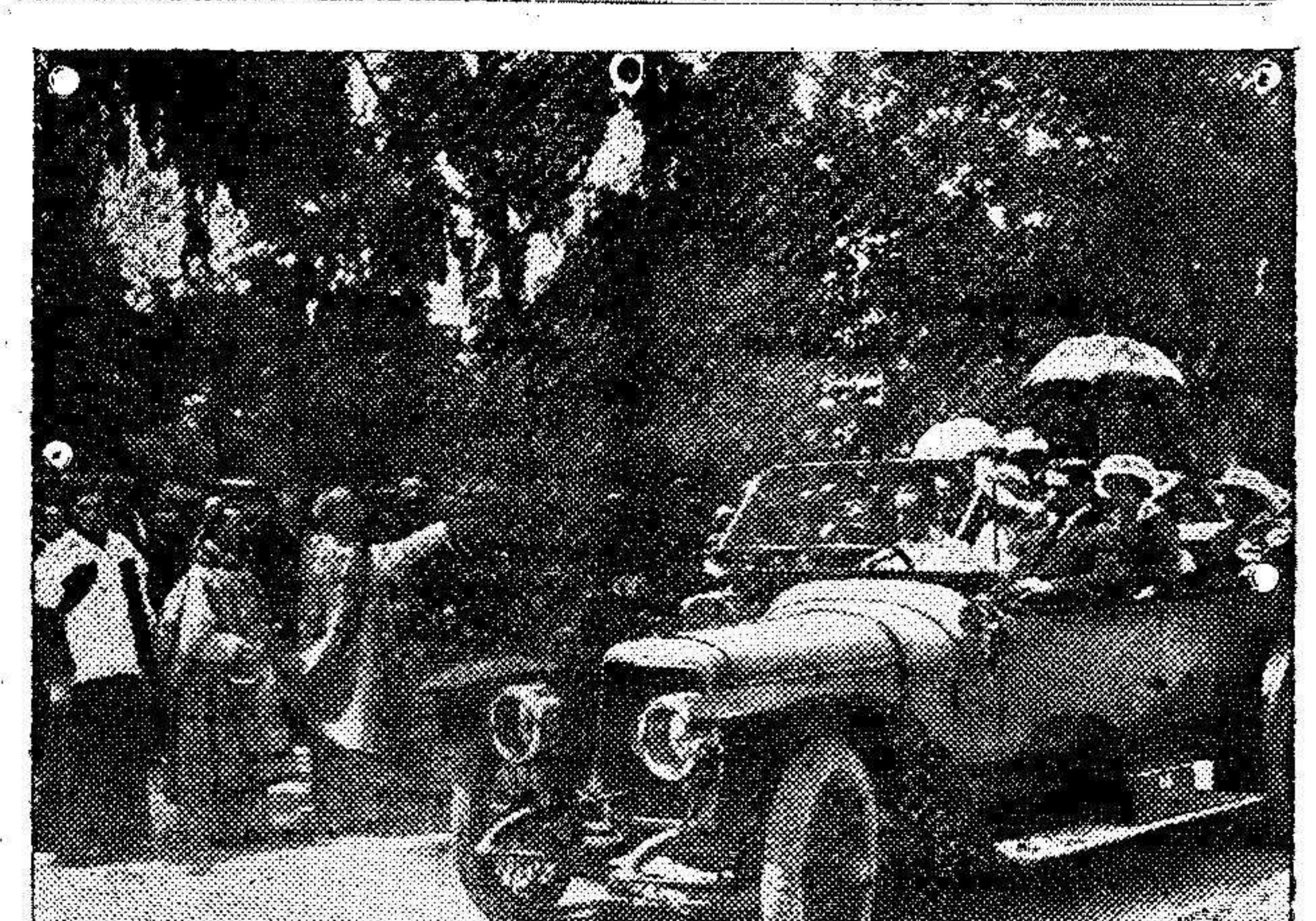
Bendición de automóviles verificada en el Retiro de Madrid por la Congregación de San Cristóbal, patrono de los automovilistas.

Las yemas de los poblados próximos, tienen la obligación de contribuir al sostenimiento del edificio y de su moka-dem, con arreglo á sus medios y España ha tenido buen cuidado de mantener el respeto debido á esos lugares sagrados, á cuya conservación se ha atendido, no pocas veces, en prueba de la tolerancia de nuestra acción.