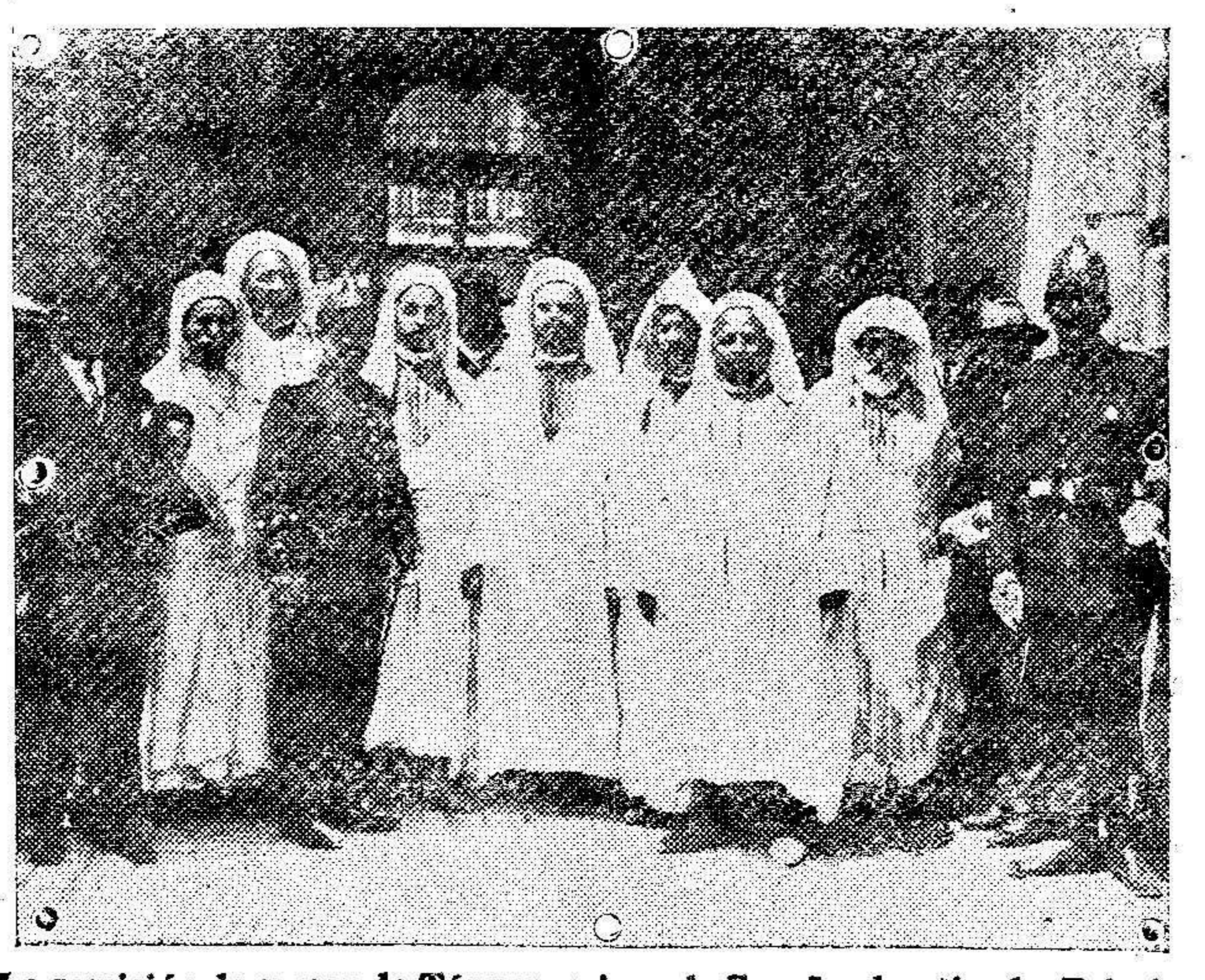
La comisión de moros de Tánger amigos de España al salir de Palacio de cumplimentar á Su Majestad.

Ver los anuncios económicos de 4.ª plana