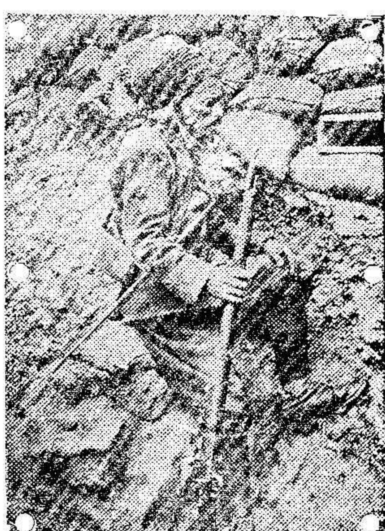
Un spahi en la trinchera.

Según nuestras noticias, se implantará en nuestro primer colegio el género de varietés para lo cual han sido ya contratadas dos conocidas y notables artistas.