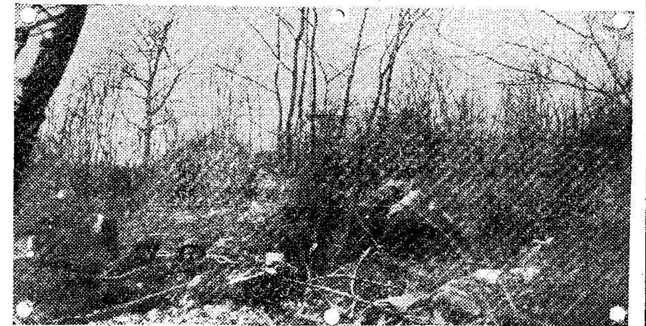
Avanzada de una compañía de zuavos en la parte sur del Bosque de los Caures.