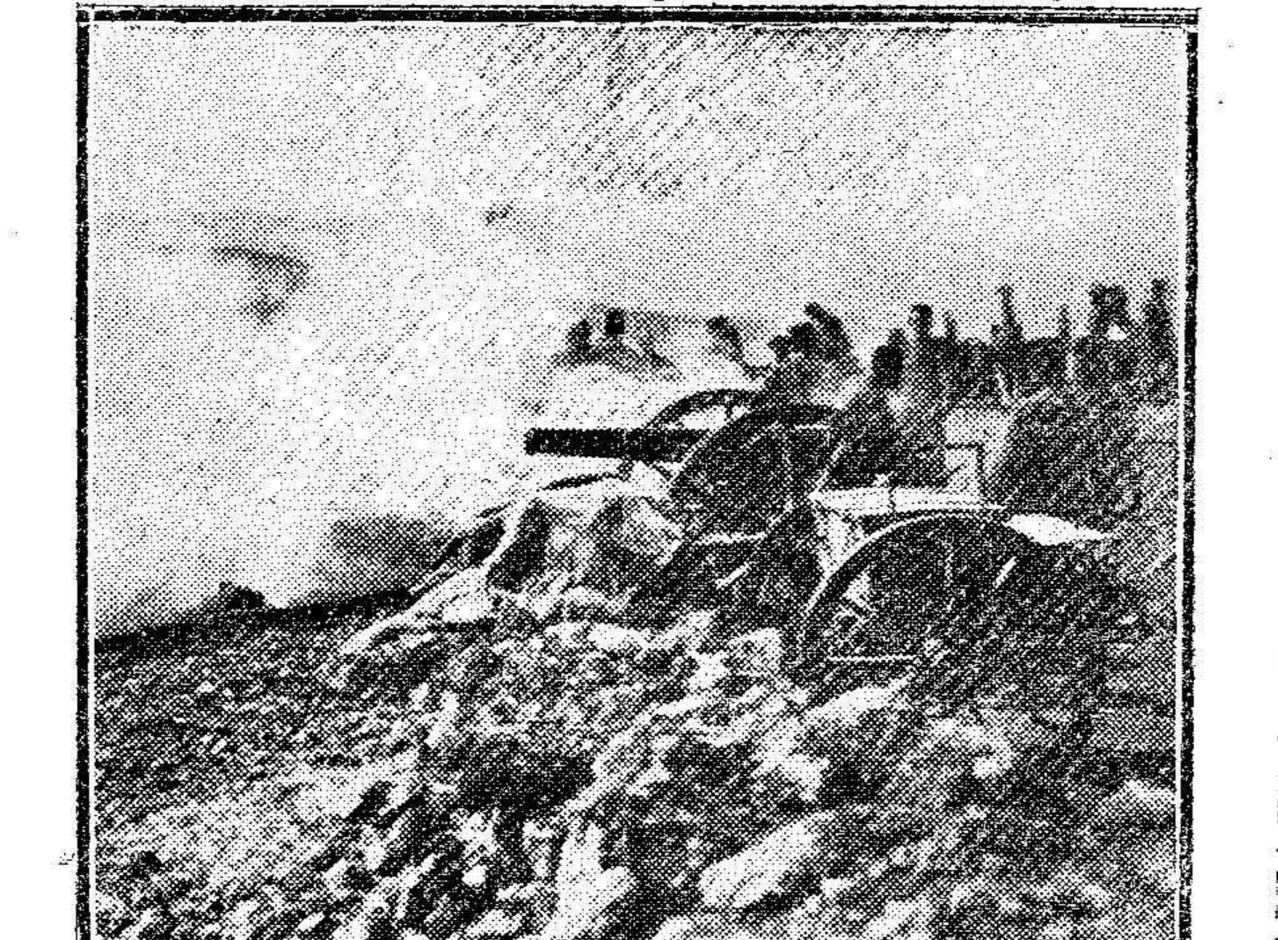
Frente occidental.—Una batería de 75 en fuego.

En los círculos políticos es objeto de comentarios la determinación del gobierno de Austria y se aplaude la corrección con que ha procedido el Gobierno, con Austria y con Francia,