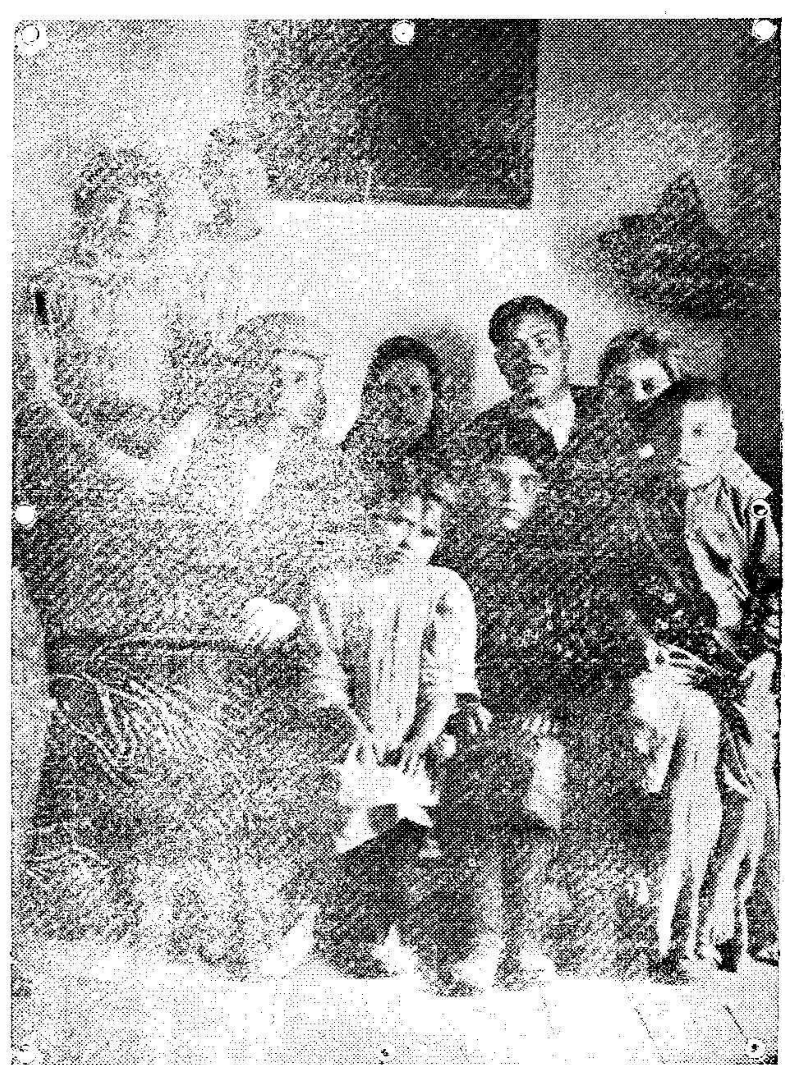
La familia de uno de los secuestrados por los moros en Ceuta, y que han llegado á Tarifa uno de los últimos días.

La compañía, en su deseo de complacer al público de Melilla, ha dejado por ahora el compromiso contraído con la empresa del teatro Cervantes de Málaga, en cuya capital dará varias representaciones una vez terminada la corta campaña artística, que mañana comienza en nuestro primer coliseo.