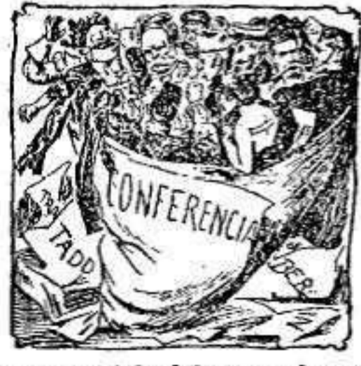
Lo que será la futura conferencia europea-oriental

Desde primero de año, se alquila la casa de la Cervicería del Mar X.