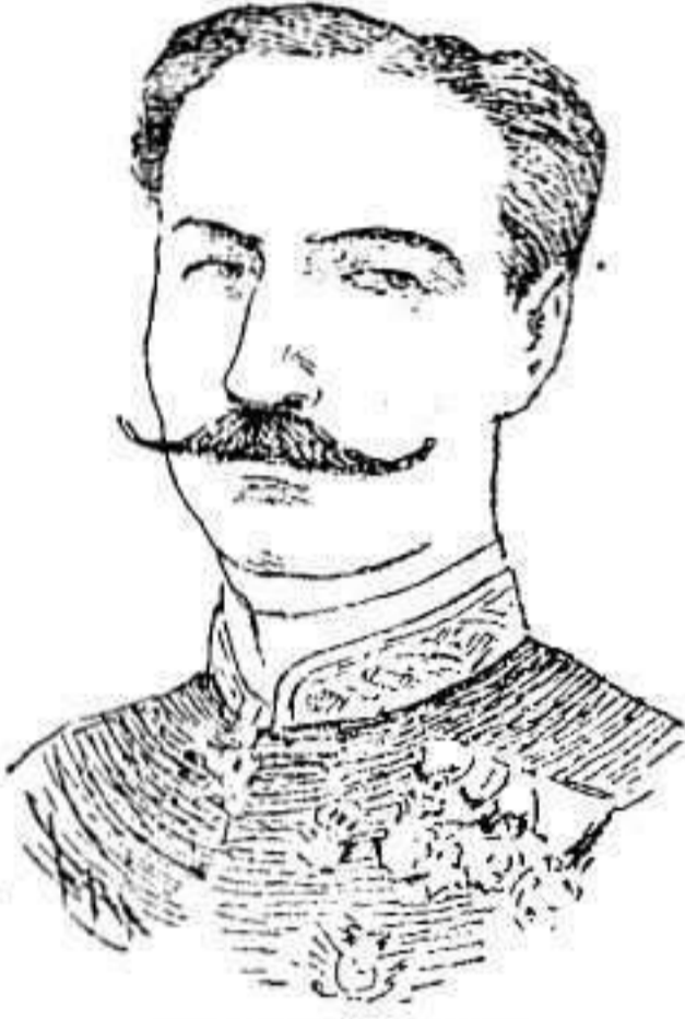
El señor Merry del Val

Los pasados días publicamos algunos datos biográficos del nuevo ministro de España en Marruecos y hoy damos á conocer su retrato.