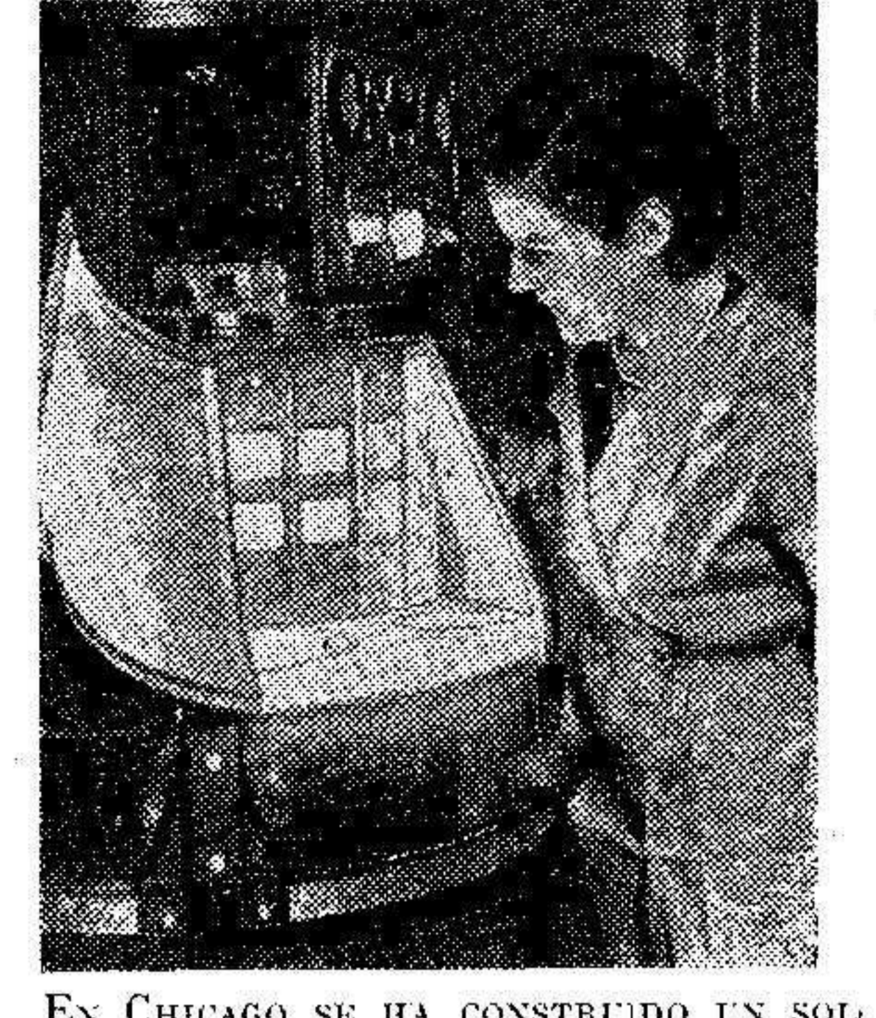
EN CHICAGO SE HA CONSTRUIDO UN SOL ARTIFICIAL, EL LLAMADO FADOMEFRO CON EL CUAL SE PUEDE COMPROBAR LA GARANTIA DE SUS RESULTADOS. LA LUZ DE SUS RAYOS DURA VEINTICUATRO HORAS, Y CORRESPONDE A LA LUZ DEL SOL DURANTE CINCO DIAS.