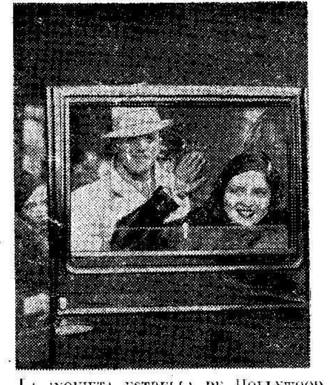
LA INQUIETA ESTRELLA DE HOLLYWOOD CLARA BOW, SE ENCUENTRA ACTUALMENTE DE VISITA EN EUROPA ACOMPAÑADA DE SU ESPOSO. LA FOTO MUESTRA A LA FELIZ PAREJA A SU LLEGADA A LONDRES, PARA VER LA PRUEBA OFICIAL DE SU ÚLTIMA PELICULA.