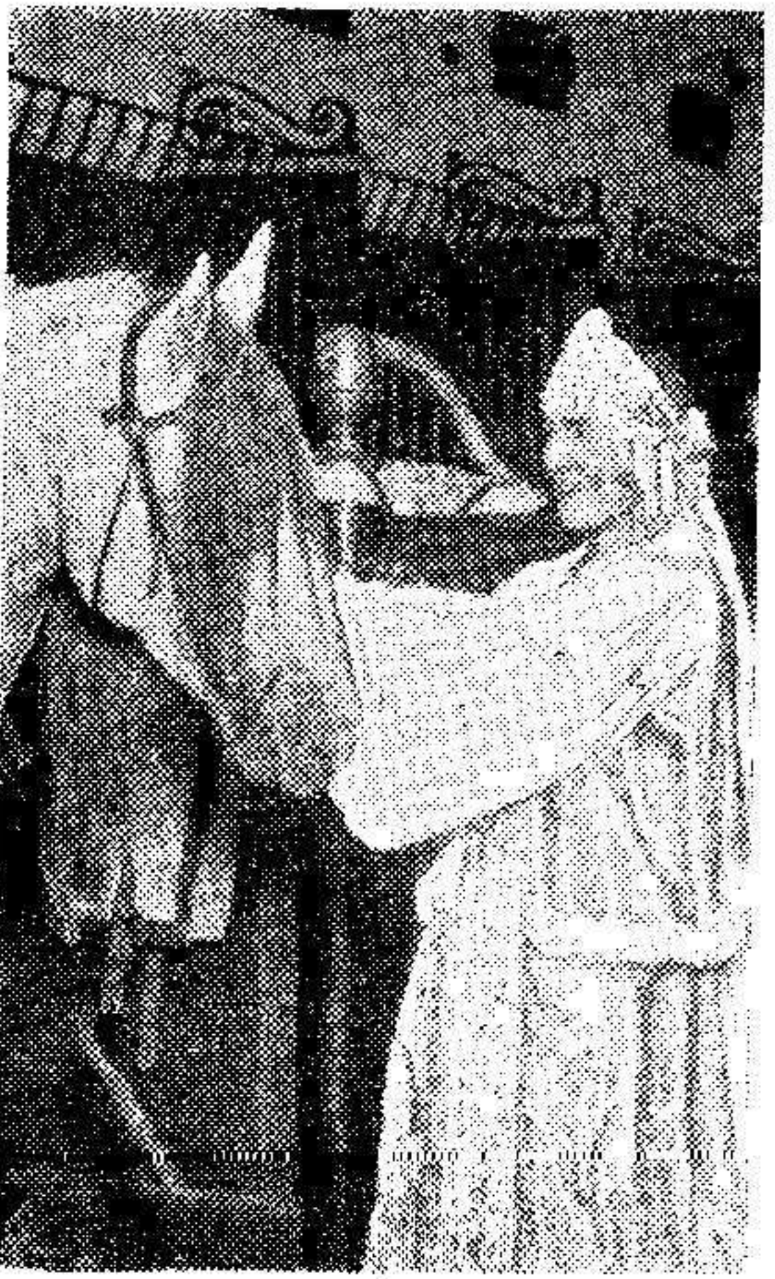
La hija del famoso monje ruso Rasputin, ha hecho su debut en el circo de París. La foto la muestra, vistiendo el traje ruso, acariciando a su caballo favorito.