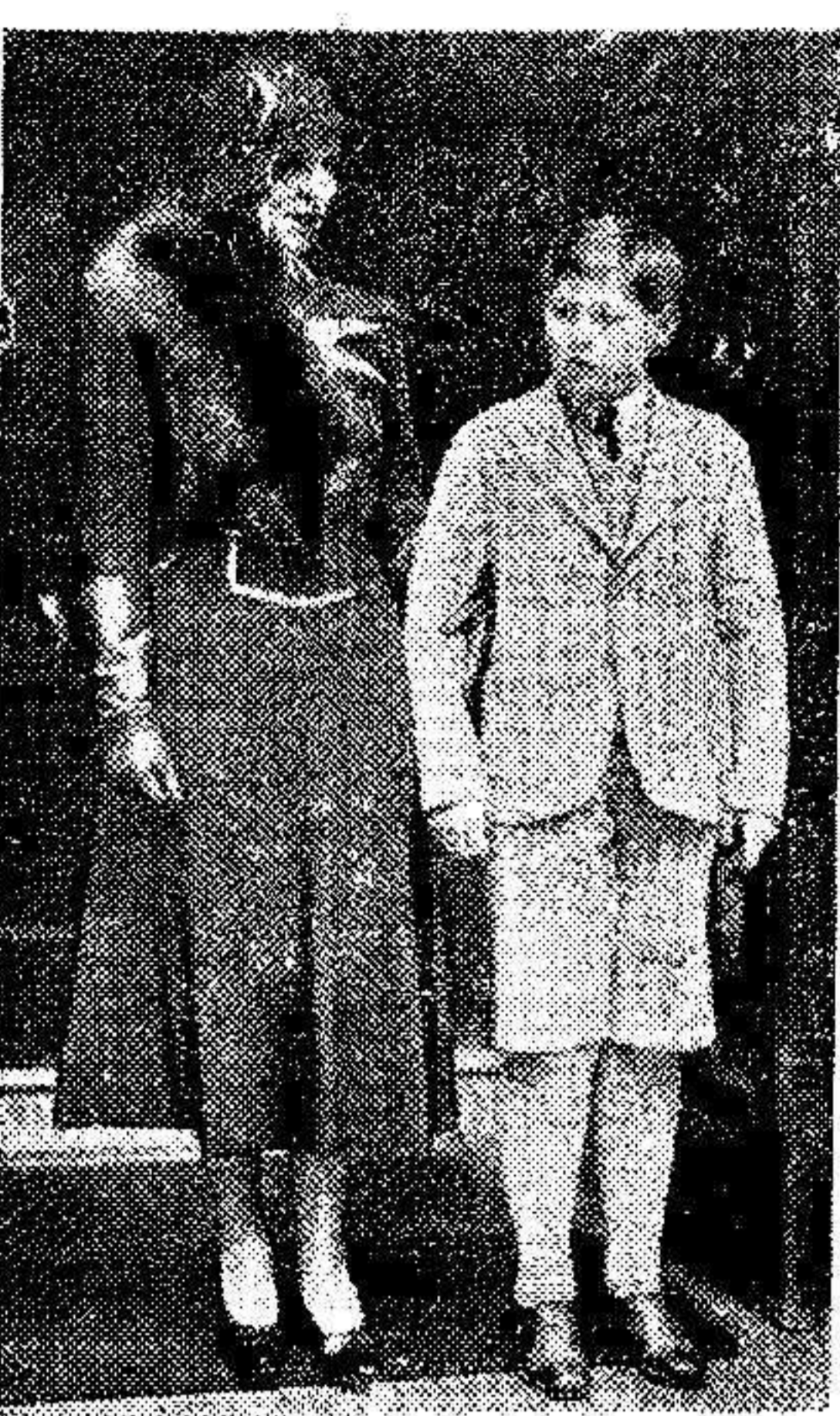
El príncipe aparece junto a su madre, la princesa Elena, durante la visita que éste hizo a Londres. Se dice que el príncipe abriga el propósito de inscribirse como alumno en una escuela inglesa, durante el próximo año.