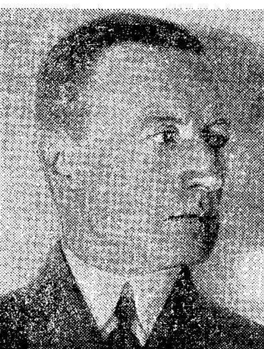
Que ha recibido la orden de ostentar la jefatura de las organizaciones jóvenes de Alemania, en una reunión no política para efectuar ejercicios físicos.