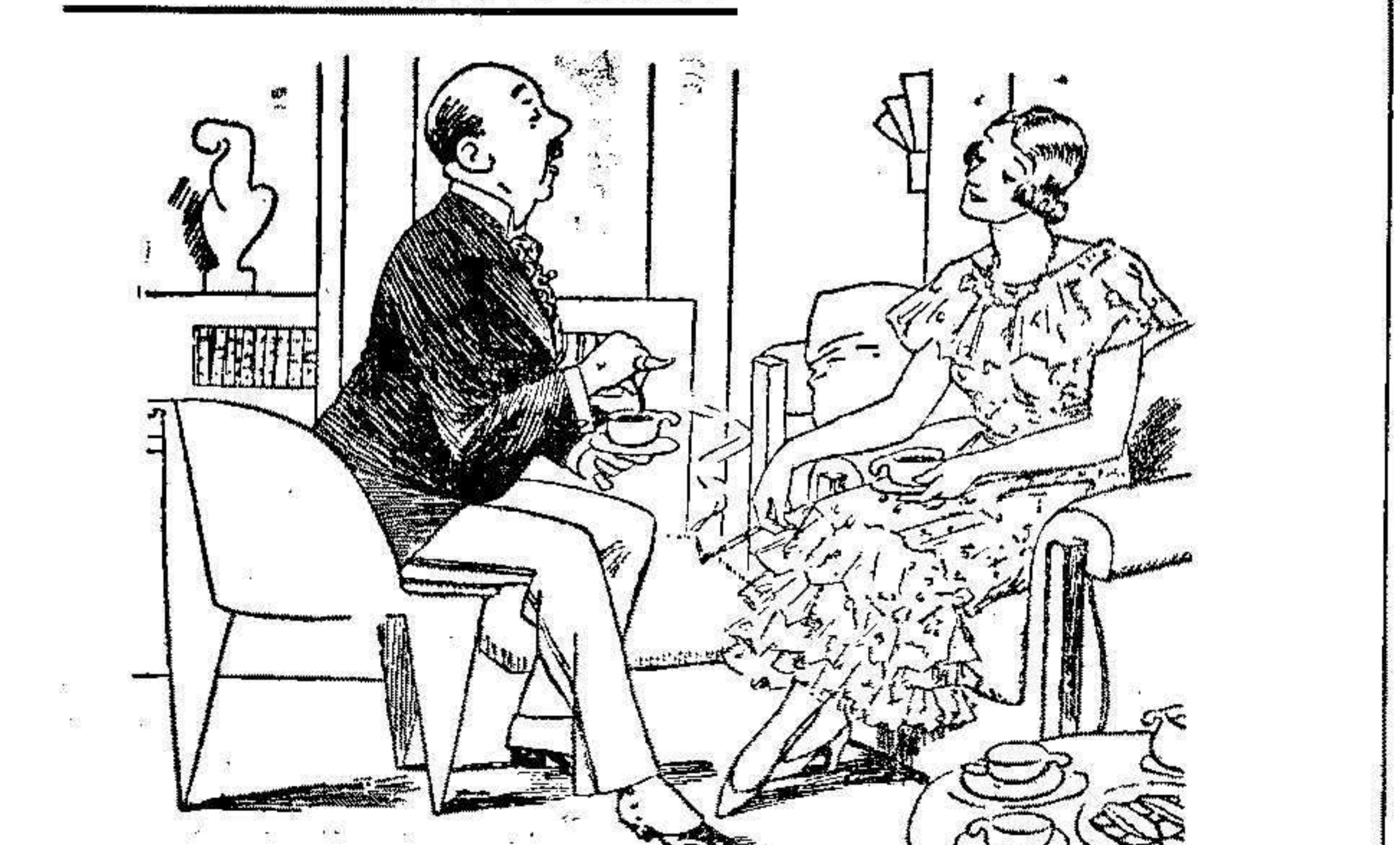
—Yo he cazado ligres furiosos, leopardos salvajes, leones imponentes... —Por favor... Cace esa mosca, que le vá a caer dentro de la taza...