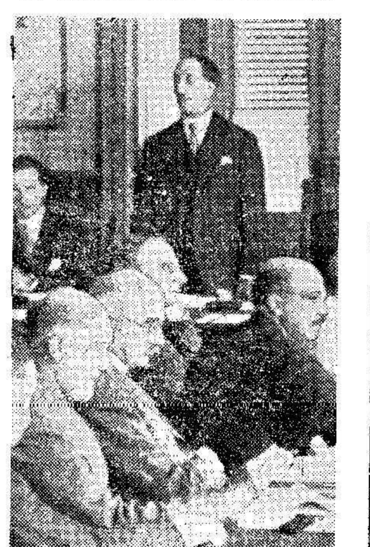
Ha quedado abierta la Conferencia en la que se tratará de la cuestión de la deuda e indemnizaciones de guerra en los Estados balcánicos. La foto muestra al Presidente de la Conferencia M. Georges Bonnet, durante un debate.