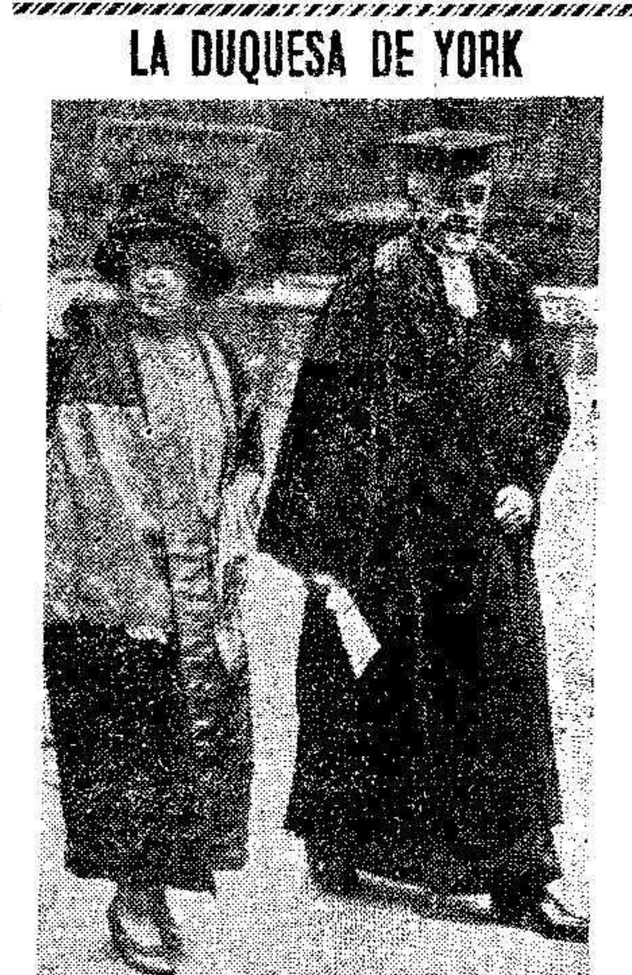
Que acaba de recibir el título de Doctor Honorario de la Universidad de Oxford. La foto muestra a la duquesa con el vicecañiller de la Universidad, después de su nombramiento.