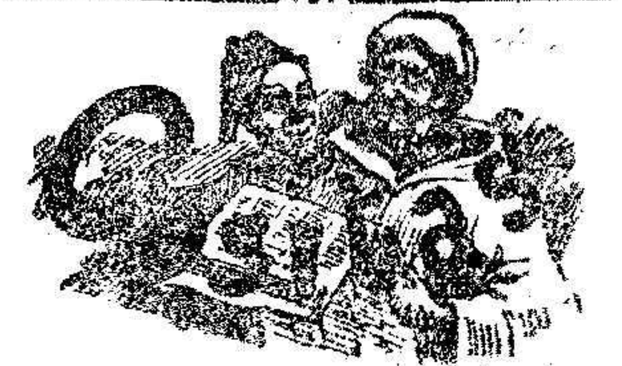
A PROPOSITO DE COMISIONES