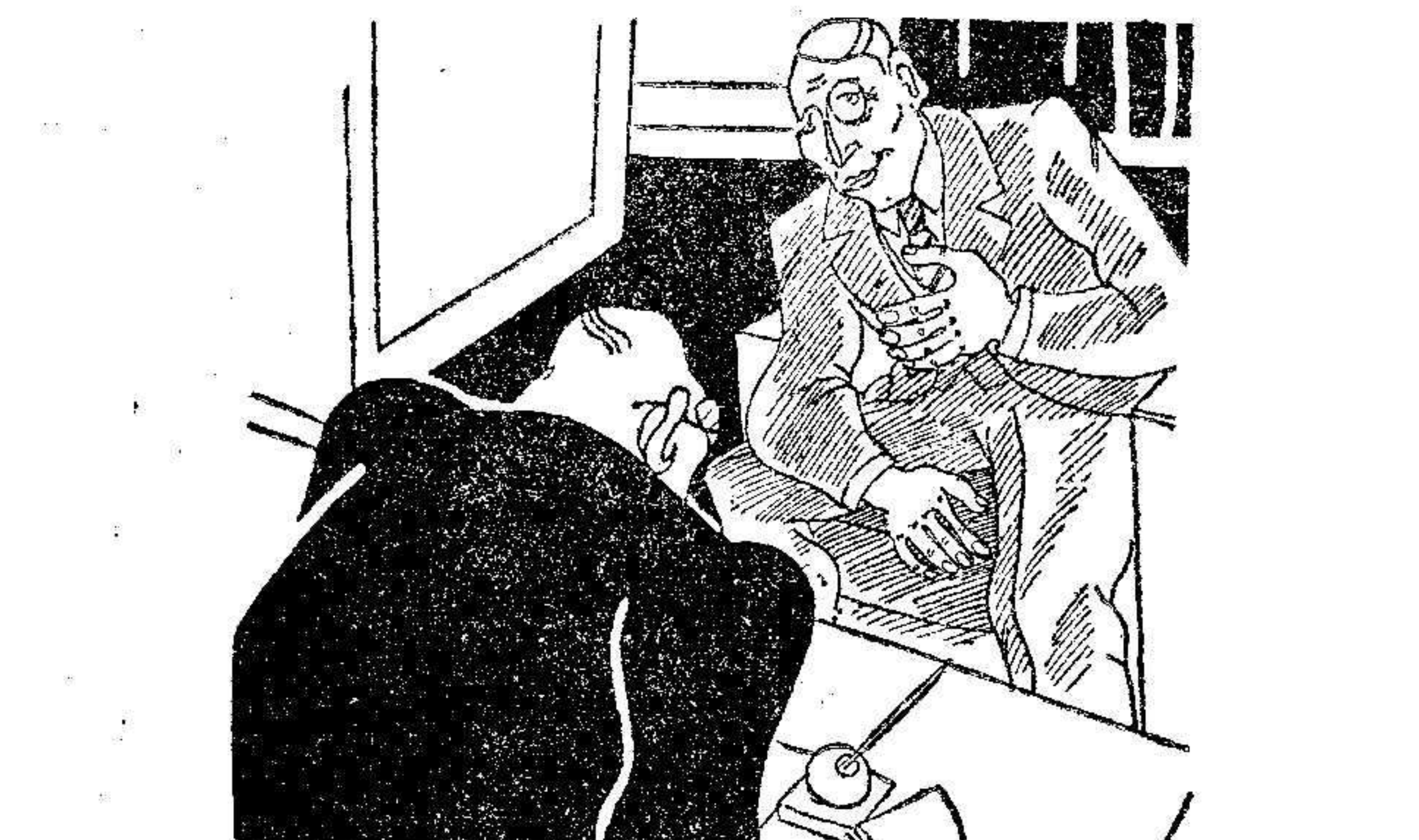
LA FAMILIA DIVERTIDA

—¿Te vienes conmigo al circo? Hay una compañía estupenda. —¿Para qué? Mi mujer hace ejercicios acrobáticos, mi hija danza sobre las puntas de los pies, mi hijo caza ratones sin trampa, la muchacha nos recita poesías... ¿Y aún quieres que vaya al circo?