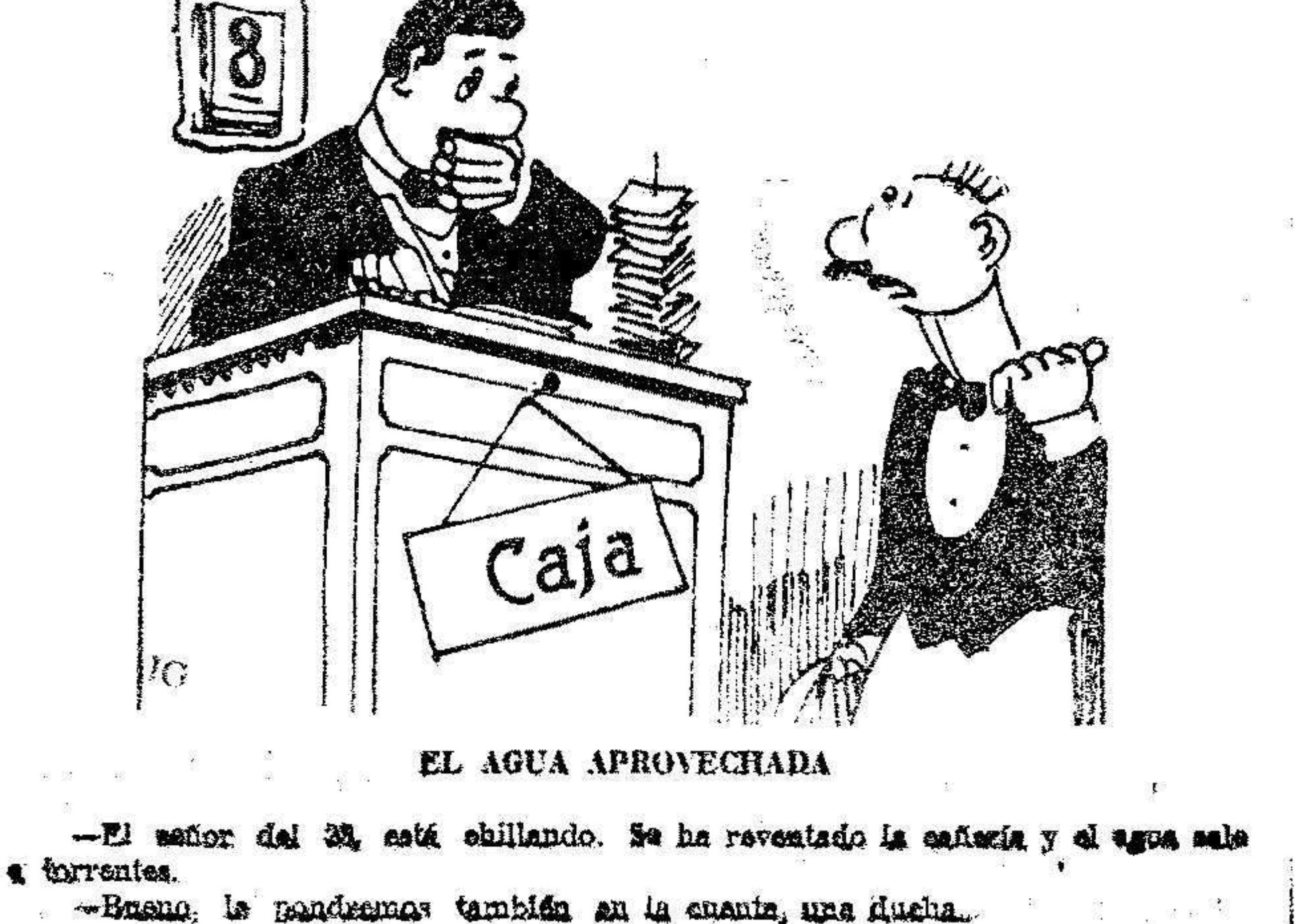
—El señor del 33, está obillando. Se ha reventado la cañería y el agua sale a torrentes. —Bueno, le pondremos también en la cañería, una flecha.

Con este título ha comenzado a publicarse en Melilla un nuevo diario de la mañana. Correspondemos al saludo que dirige a la prensa local, y le deseamos próspera vida.